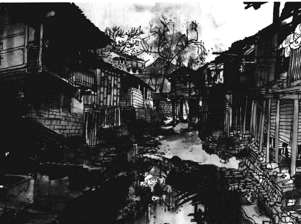
故乡水巷(水墨画) 黄永玉作