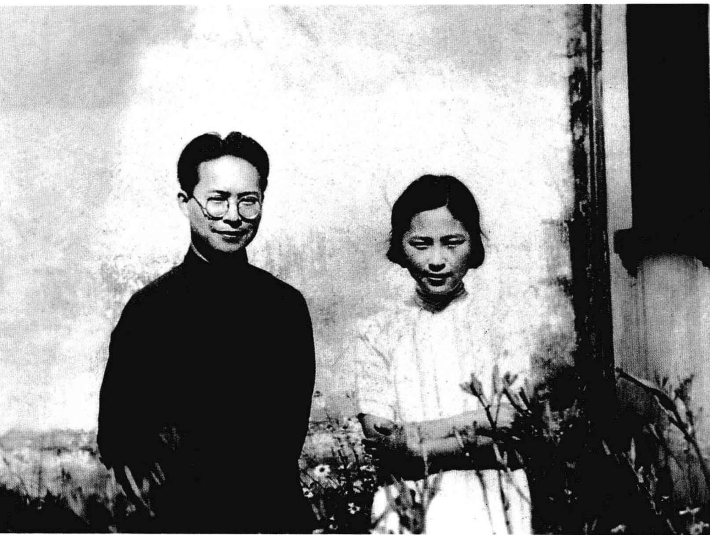
1935年夏，沈从文与张兆和在苏州