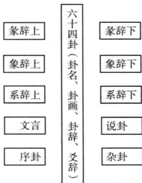
图 1-1 《易经》构成图

“经文”之外，还有“传文”，是对“经文”的解释或综述，“传文”包括了“彖(tuàn)辞(上、下)”、“象辞(上、下)”、“文言”、“系辞(上、下)”、“说卦”、“序卦”、“杂卦”等七篇十部分，也称“十翼”。如图1-1所示。