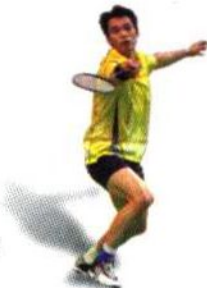
历届奥运会羽毛球比赛金牌