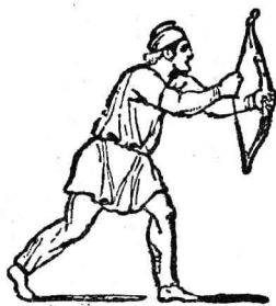
第一日耳曼弓箭手