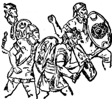
羅馬軍隊中的日耳曼兵