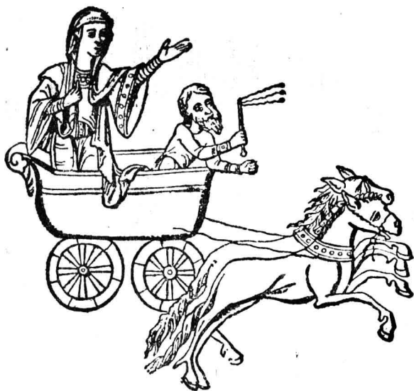
一千多年前的法蘭克人的兩輪車