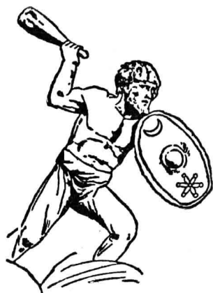
一個拿着鏈與盾的日耳曼戰士