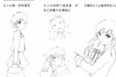
主人公：一封情书 主人公的另一个追求者：对自己的魅力充满信心 可爱的主人公喜爱的男生：可爱的主人公喜爱的男生