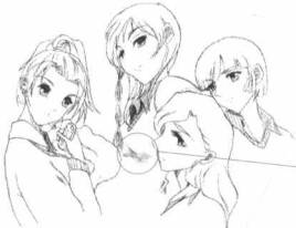
人物服饰的描绘可以体现她们的个性。