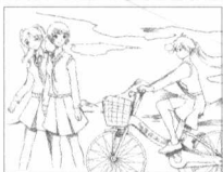
表现出清早起床睡眠不足的主人公迷迷糊糊骑自行车上学的状态。