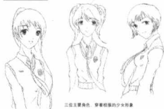
三位主要角色，穿着校服的高中女生