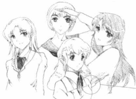
可以运用不同的线条和色彩来表现她们的个性。