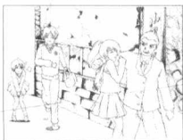
迟到的主人公在请求班主任开一面。