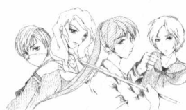
人物服饰的描绘可以体现她们的个性。