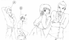
学生A和B：努力表现的热情 同学B是主人公的主人公在上课 教师主任：迟到的批评