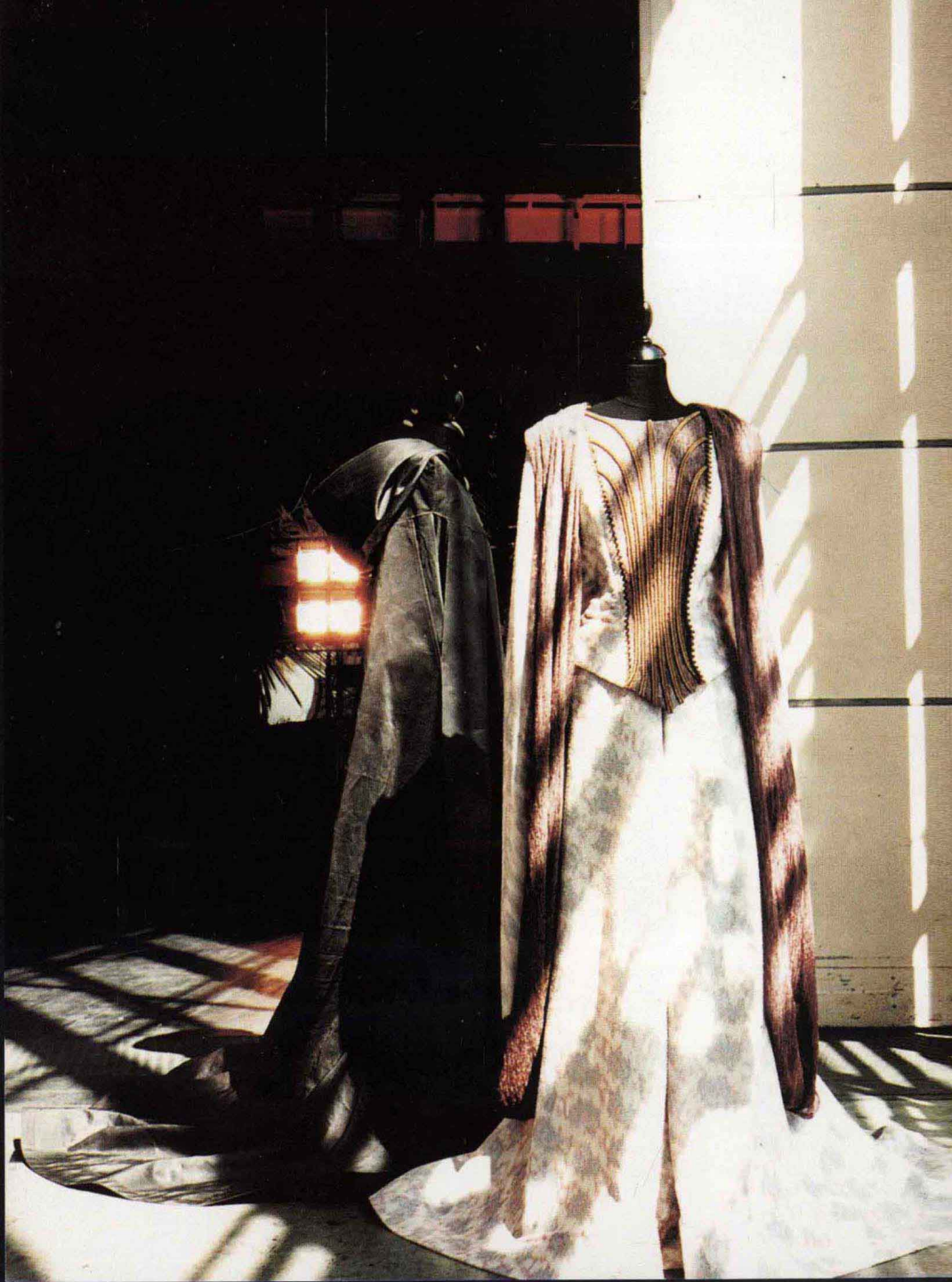
1997 · 崔斯坦與伊索克 奧地利 Bühnen Graz Opern Haus (左) · 1998 · 羅生門 台灣 (右)