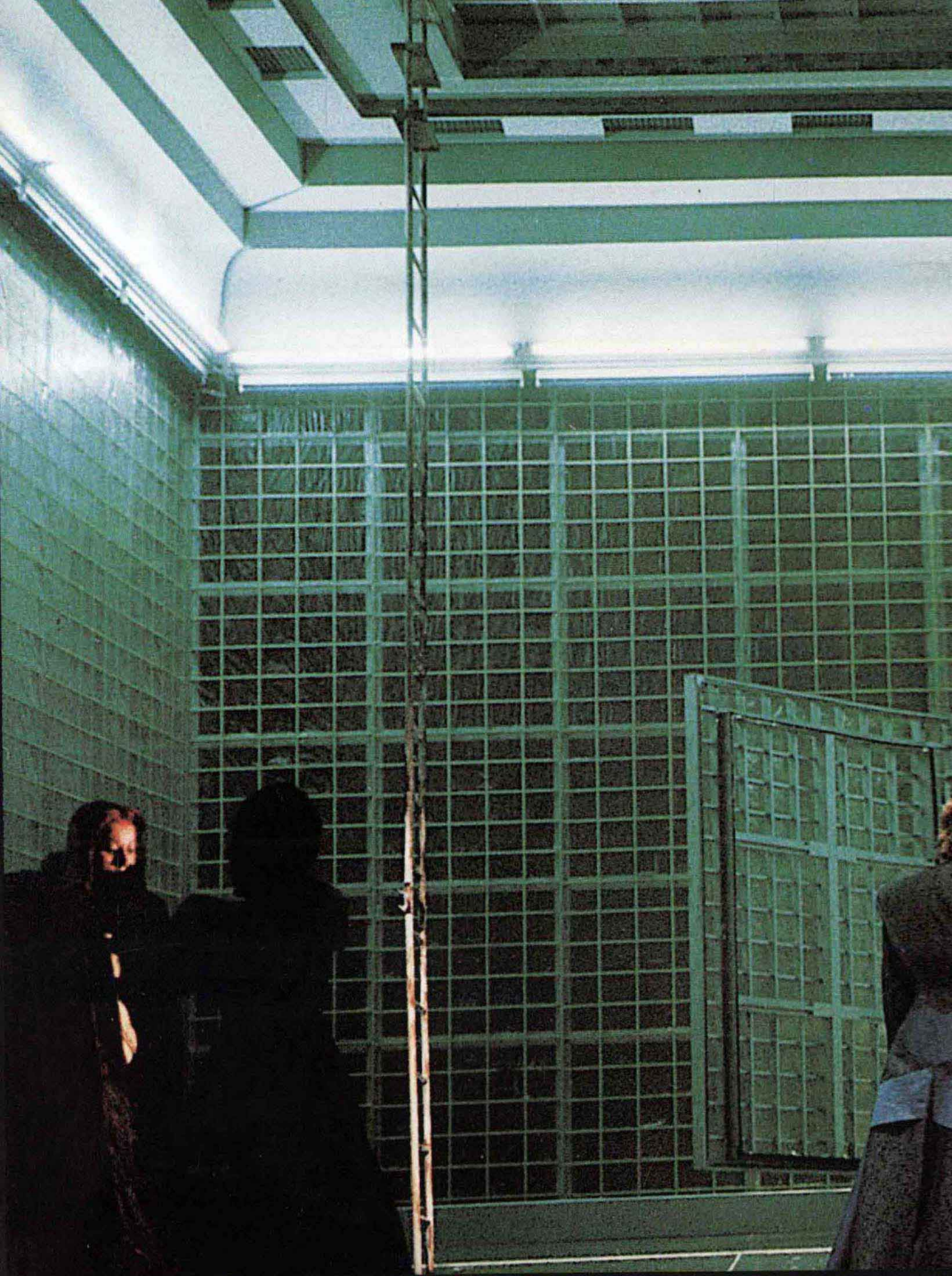
1997 · 崔斯坦與伊索克 奧地利 Bühnen Graz Opern Haus