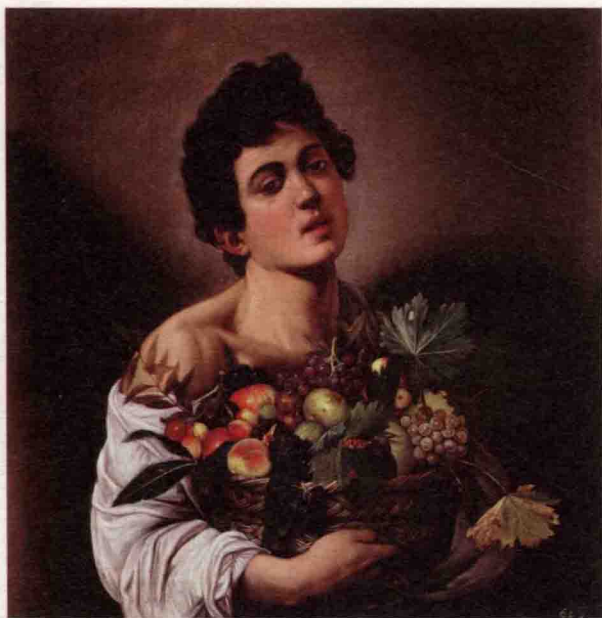
《捧水果篮的男孩》Boy with a Basket of Fruit 1593-1594