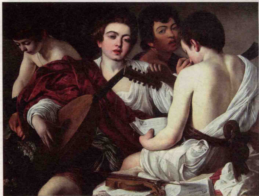
《音乐家们》The Musicians 1595