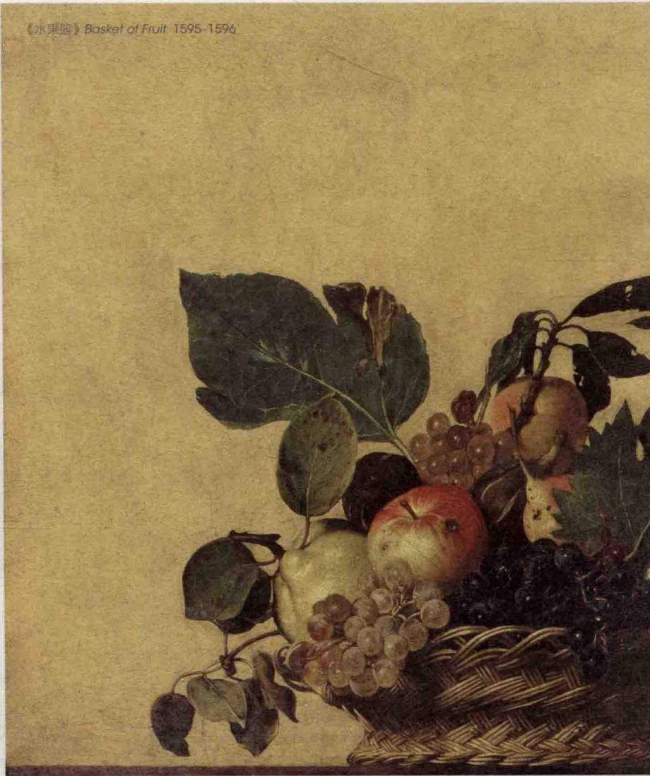
《水果篮》Basket of Fruit 1595-1596

这幅就更厉害了，看似是一篮普通的水果，但仔细观察一下，你就会发现，这些放在今天想都不想就会被ps掉的部分，他都仔细地画了出来。