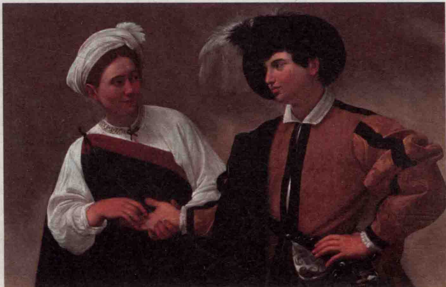
《算命者》 Good Luck 1594-1595

可能是因为请不起模特，这一时期，他以市井小民为题材，画了许多“风俗画”。这些作品已经开始逐渐展露出他的绘画功力。