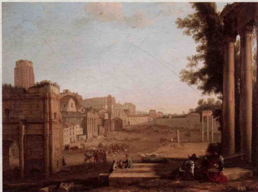
克劳德·洛兰《凡西诺广场》 Campo Vaccino 1640s by Claude Lorraine

卡拉瓦乔刚到罗马时混得挺惨，主要就靠“跑跑龙套”和给大明星演演“替身”什么的为生（在街边摆摊卖画和给成名的画家当枪手）。