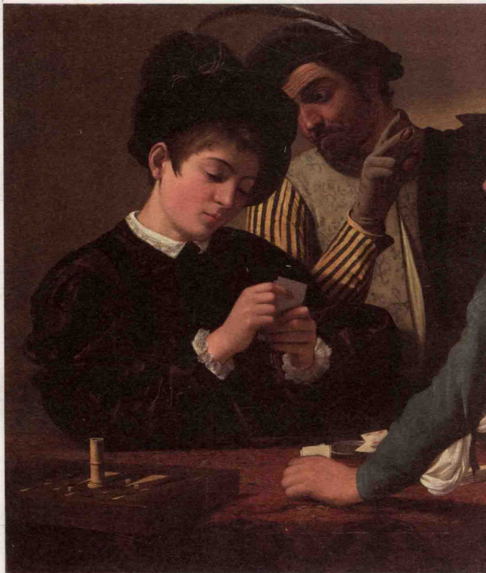
《纸牌作弊老手》 The Cardsharps 1595

卡拉瓦乔擅长通过人物的表情和动作表现出紧张的气氛，同时抓住观者的视觉神经，使观者融入到画面中去。这幅画，一看就知道，画的是两个老千串通起来骗钱的场景。