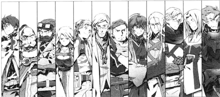
【▲ 集结于圆桌会议的公会会长们】