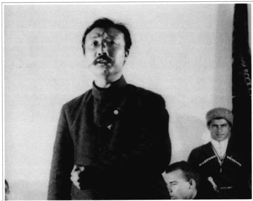
一九二四年九月李大钊在莫斯科大剧院“不许干涉中国协会”组织的大会上讲演