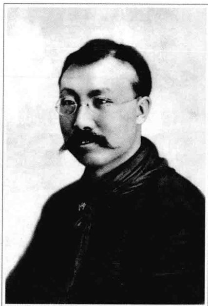
在苏联出席共产国际第五次代表大会时的李大钊

送与 李辛白先生 李辛白先生 辛白先生先生 之推出一号至 第九号的海图 评论工作寄赠 東田、四象胡同 張岱松先生以 及按期修寄中 知 刻安 李辛白