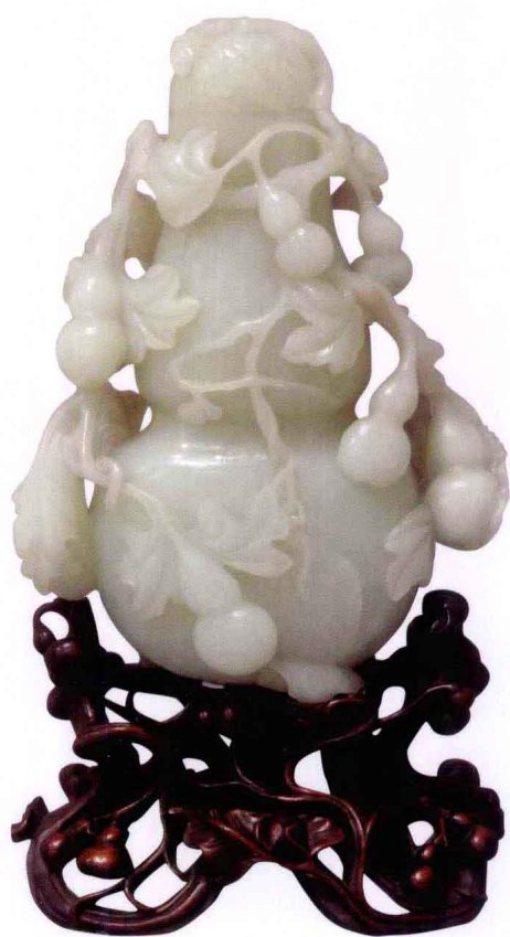
清代·和田玉葫芦瓶