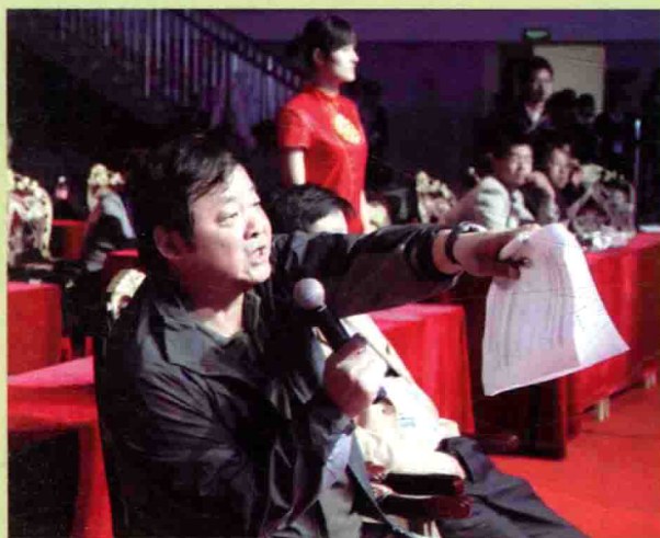
作者在某主题活动 开幕式现场指挥预演