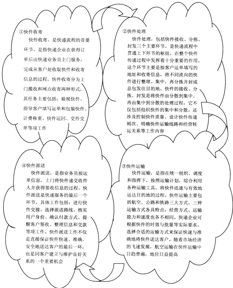
图 1-1 快递流程四大环节的具体内容