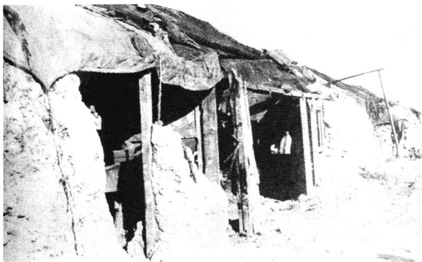
◆ 1205 钻井队到达大庆油田后住过的旧马棚