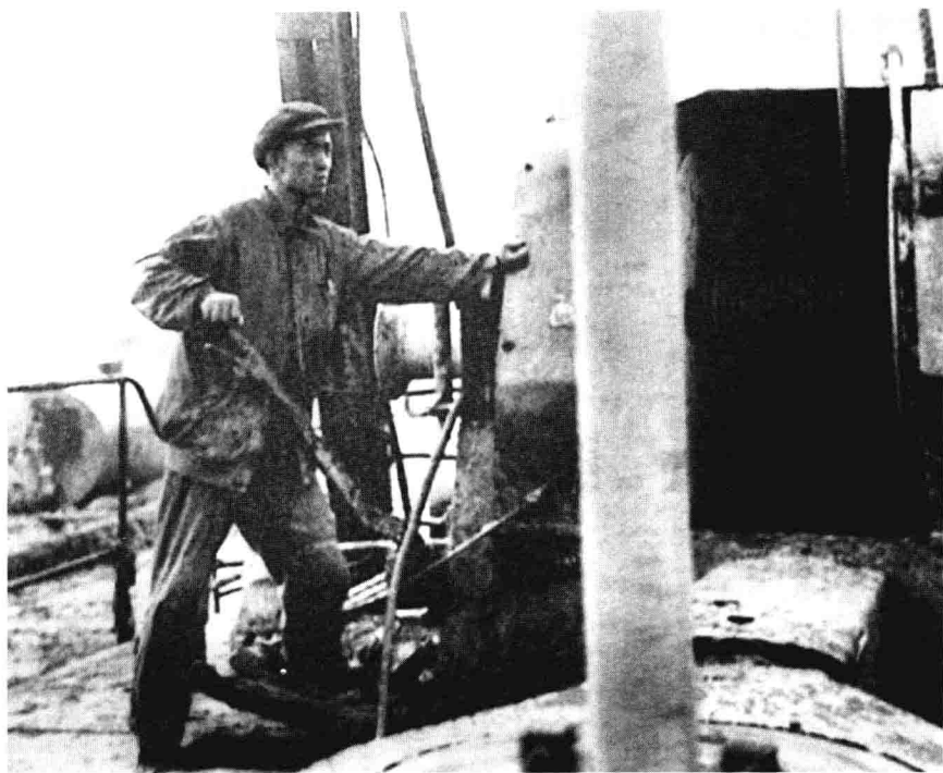
◎ 当上司钻的王进喜在钻台上