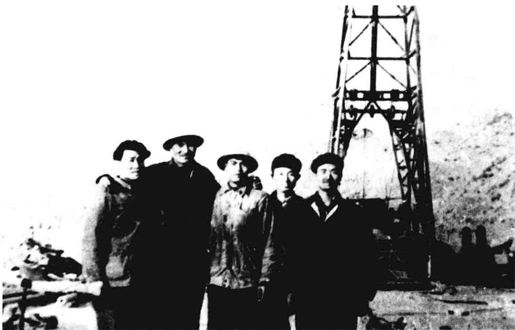
◎ 1956年当队长后，王进喜（右）在井场和战友们合影