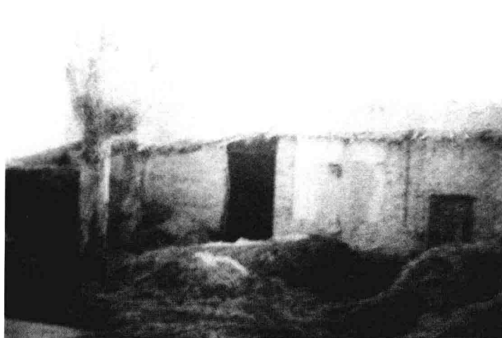
❶ 王进喜故居。1923年10月8日，王进喜出生于甘肃省玉门县赤金堡，6岁跟着父亲讨饭，9岁同父亲出劳役，10岁给地主放牛。

1960年3月从玉门到大庆，我是带着一股子气去的。新中国刚成立时，我觉得玉门油矿很大，出油很多，以后