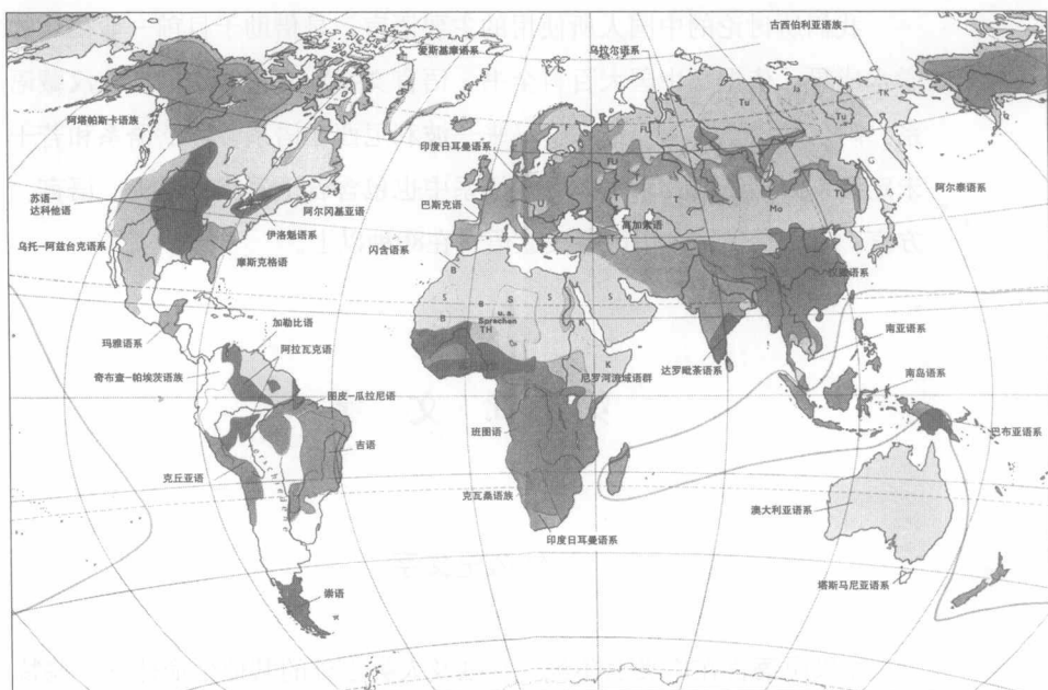
世界语系分布图（选自《世界语言简史》）