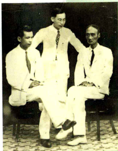
鄭子瑜（左）訪問江英華醫生（右）時攝。 （一九三九）

院習醫，翌年轉入香港西醫書院。畢業後積極進行反清革命活動。一八九四年在檀香山創立興中會，次年設總會於香港。一九〇五年在日本組成中國同盟會，確定「驅除韃虜，恢復中華，建立民國，平均地權」的綱領，提出「民族、民權、民生」三民主義學說，一九一一年武昌起義成功，推翻滿清，建立中華民國，他被推選為臨時大總統。一九二五年三月十二日在北京病逝。