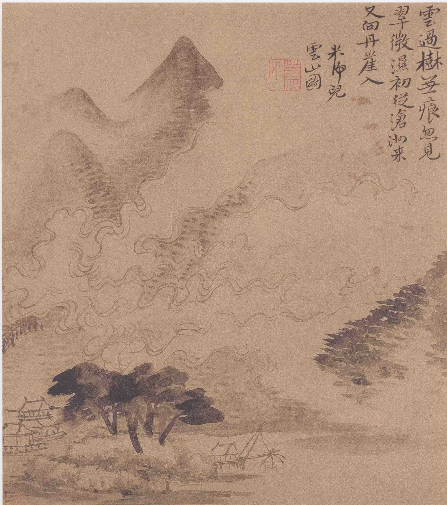
山水图册之三 金笺墨笔 23.5cm×21cm 上海博物馆藏