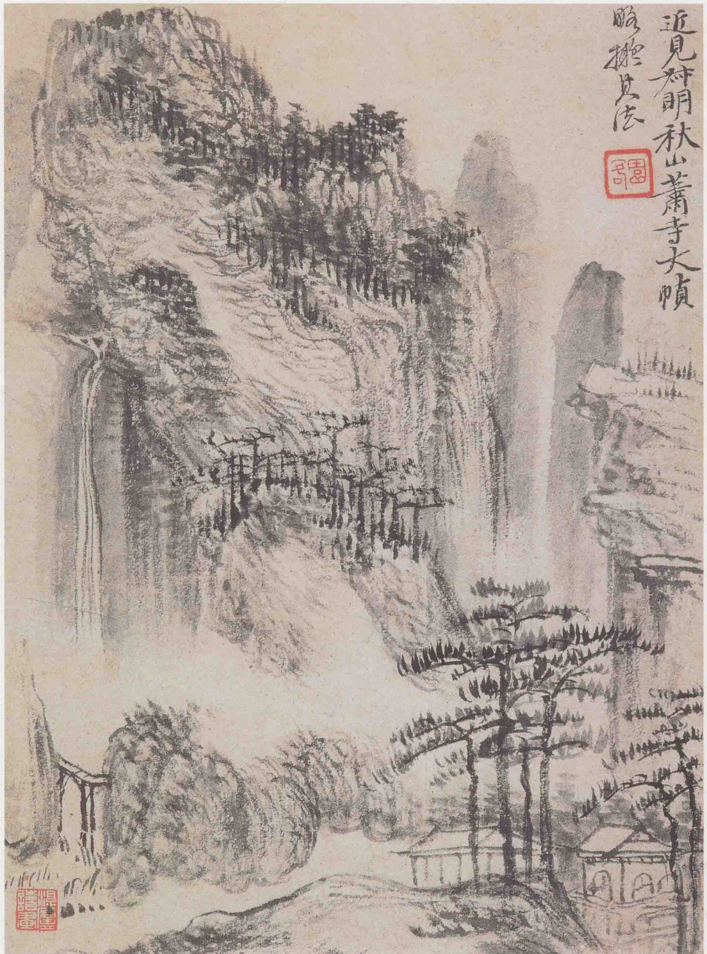
山水图册之六 纸本设色 26cm×19cm 无锡市博物馆藏