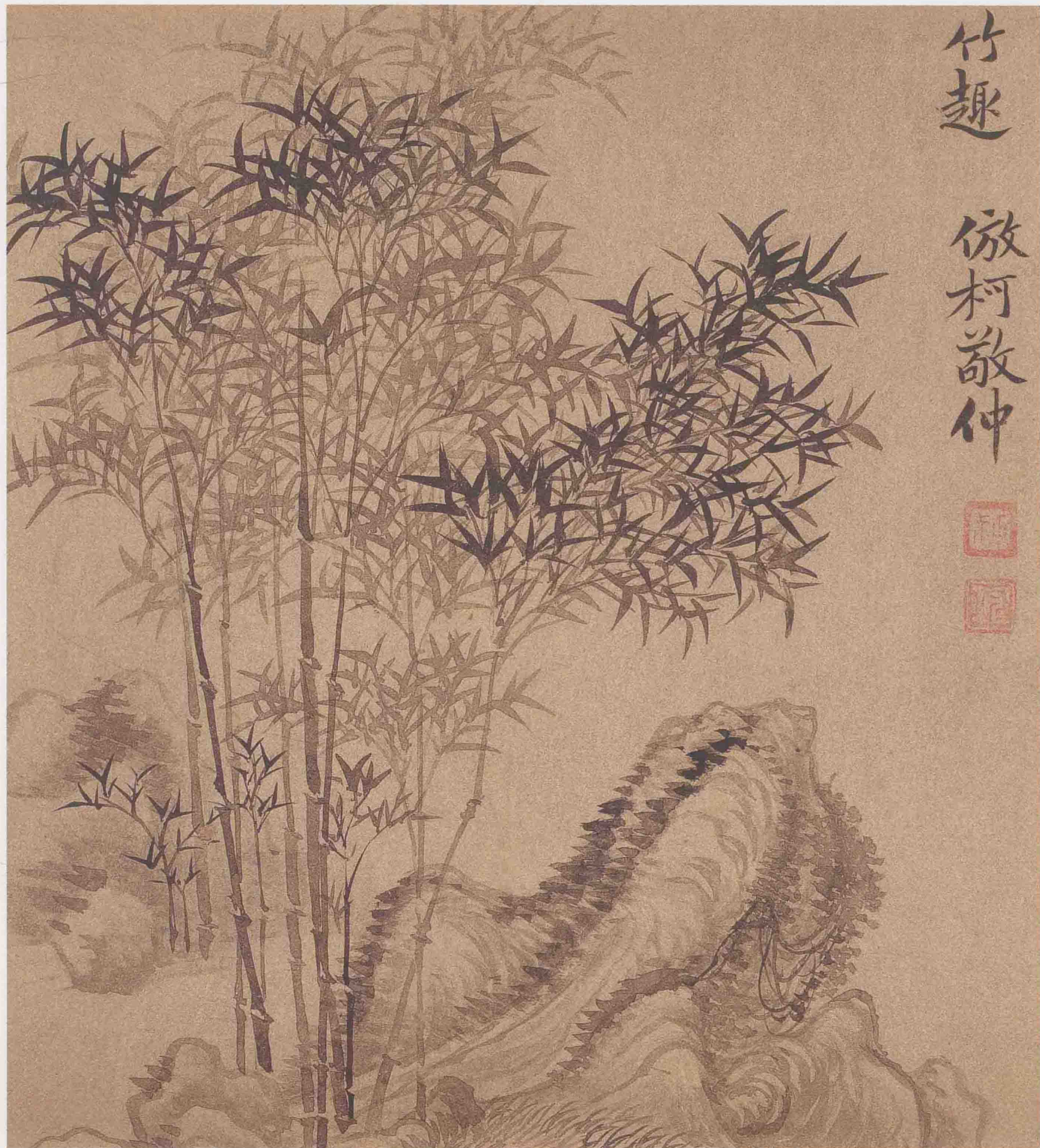
山水图册之四 金箋墨笔 23.5cm×21cm 上海博物馆藏