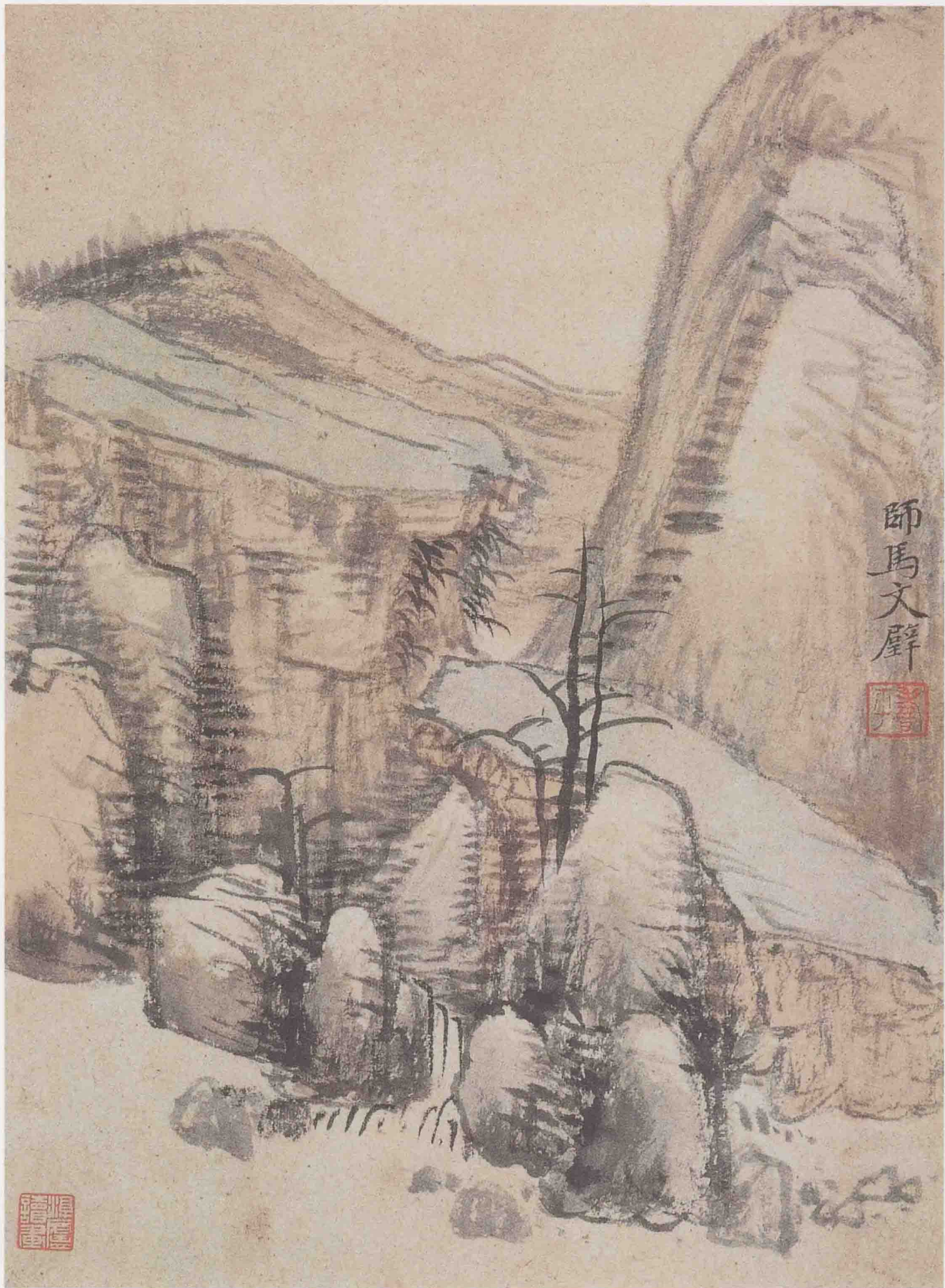
山水图册之四 纸本设色 26cm×19cm 无锡市博物馆藏