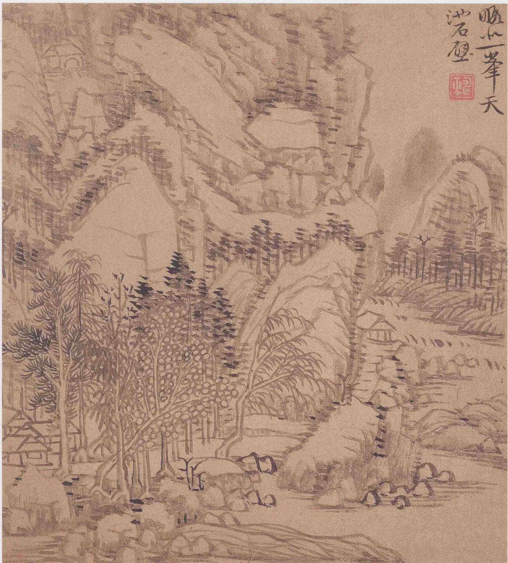
山水图册之二 金笺墨笔 23.5cm×21cm 上海博物馆藏