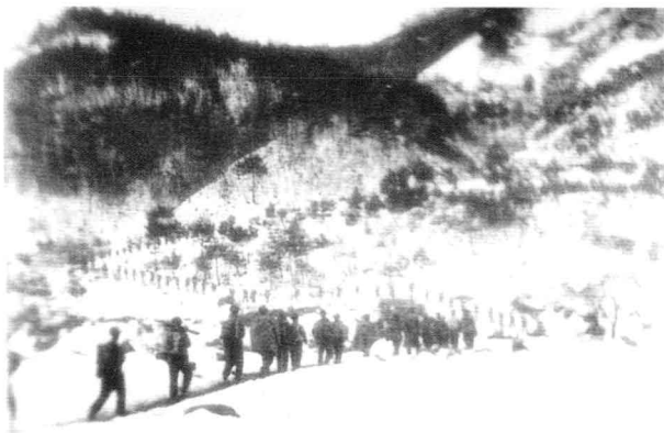
1950年12月，第27军238团向咸兴方向追歼逃敌。