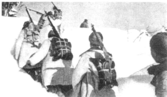
志愿军第9兵团部队踏着齐腰深的积雪，翻山越岭向长津湖地区开进。