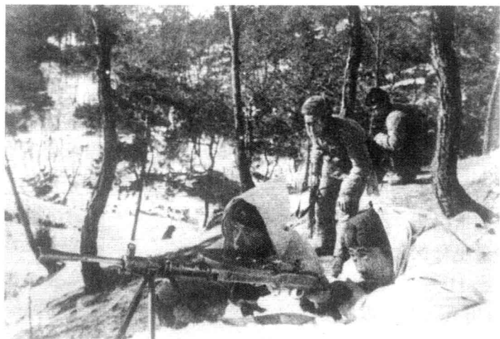
长津湖战役期间，志愿军和朝鲜人民军并肩作战。