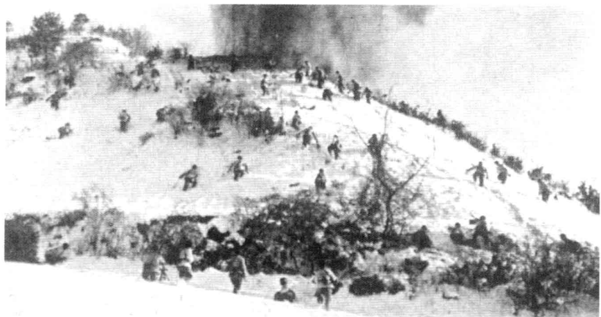
长津湖战役中，志愿军战士向被包围的美军展开猛烈进攻。