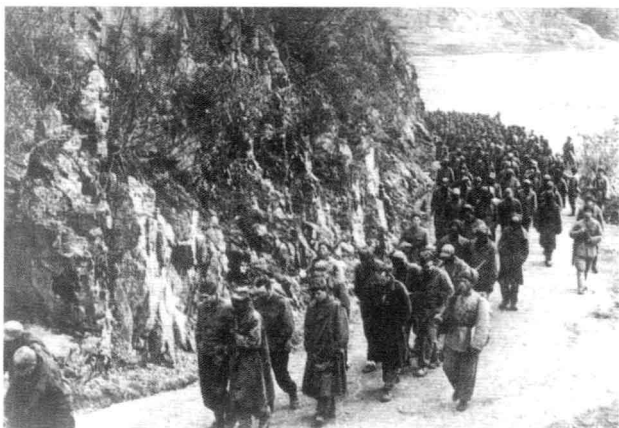
长津湖战役中，被志愿军战士押下战场的“联合国军”战俘群。