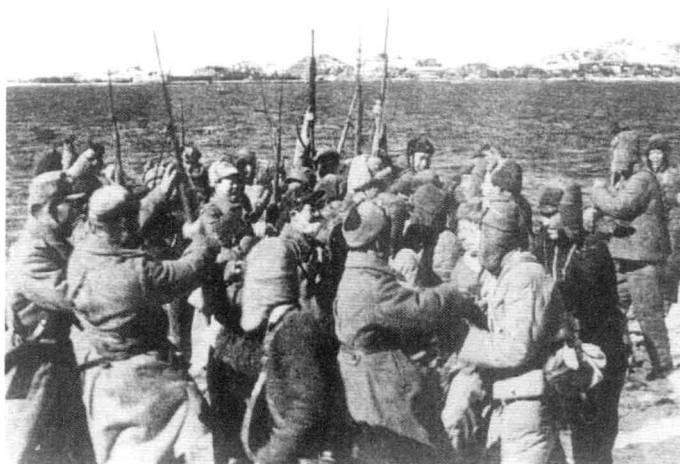
1950年12月24日，第9兵团战士追击溃逃的美军至东海岸，与朝鲜人民军会师，长津湖战役胜利结束。