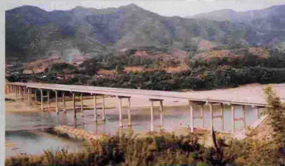
三河坝朱德纪念大桥