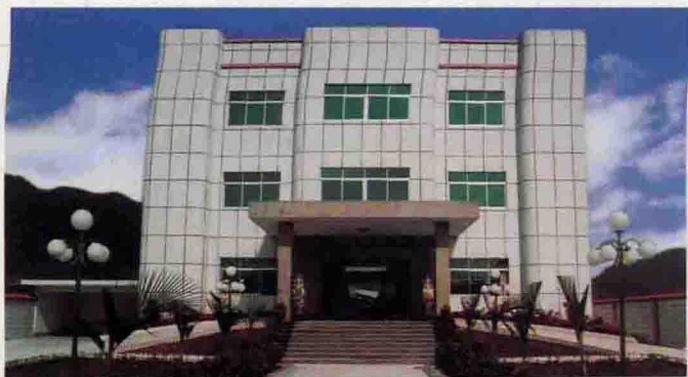
▲ 雄伟的村委会办公大楼