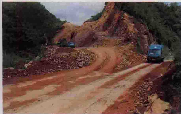
▲ 正在改造中的银江双坝金刚窟路段