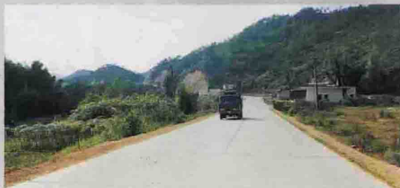
高标准建设的县通镇二级公路