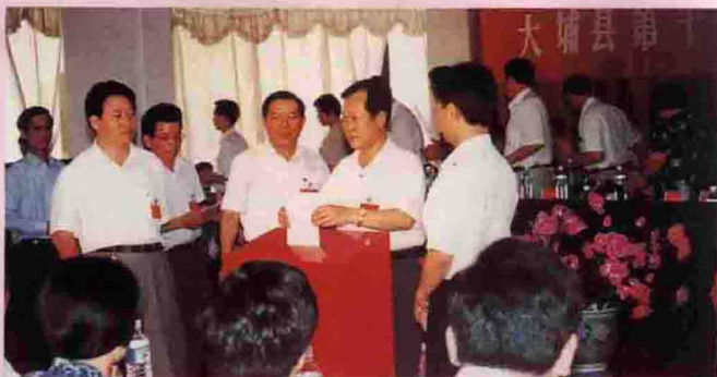
▲ 投下庄重的一票