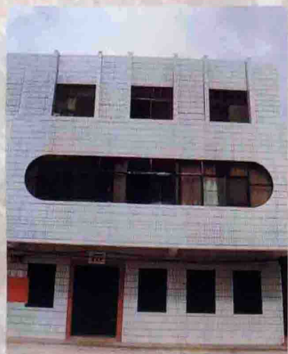
▲ 平原财政所办公楼（该所连续两次被评为省文明财政所）