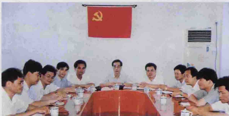
▲ 团结务实、开拓进取的领导班子

双溪镇地处 埔饶交界、梅潭 河上游，省道 1938 茶上线贯穿 全境，境内资源 丰富，主要有石 灰石矿产和久负 盛名的三溪茶， 境内有清泉、远 水两溪，水力资 源丰富。现有镇 建水电站