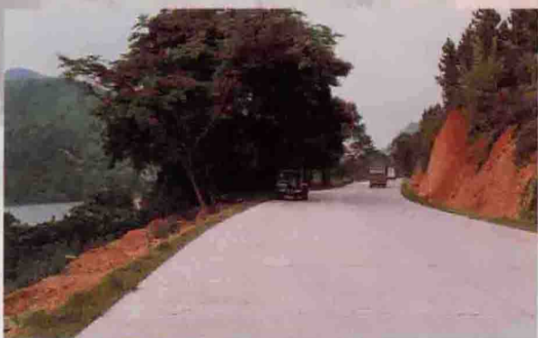
▲ 已经改造的大梅线三河至大麻段超二级公路