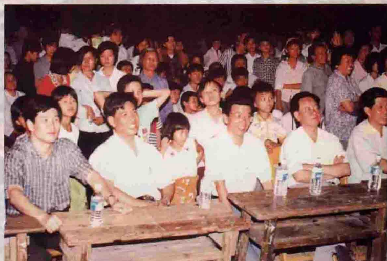
▲ 县领导在茶阳观看农税宣传文艺晚会节目