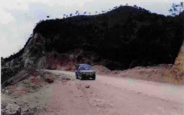
▲ 原全县最陡(纵坡18%)的长上公路北中岗现已改造为纵坡仅6%的二级公路