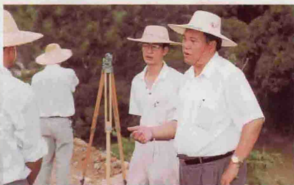
▲ 局领导在抗海线现场指导测量设计工作