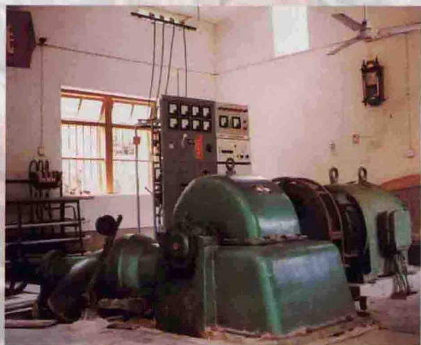
▲ 该局帮助挂扶单位大东洋溪村人股兴建的大进电站(装机125千瓦)