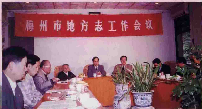
▲ 市方志工作会议在大埔召开