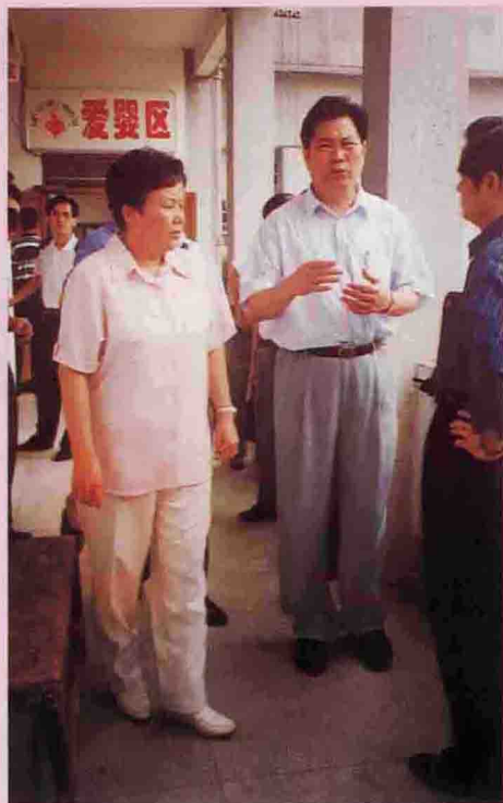
▲ 6月2~3日，广东省副省长李兰芳、省卫生厅厅长黄庆道一行来大埔考察检查医疗卫生工作。图为在大麻中心卫生院考察检查