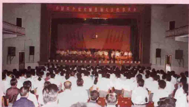
▲ 中国共产党大埔县第八次代表大会于6月1日在县城召开。图为大会会场