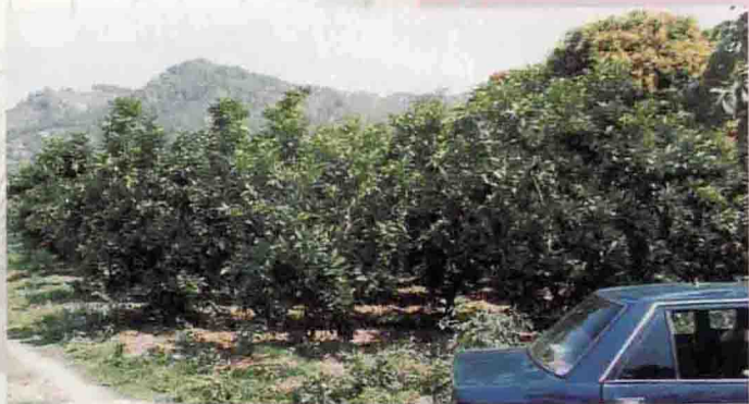
▲ 侯北村年产40万斤的百亩蜜柚场

百侯镇侯北村位于百侯镇中心地带，梅潭河北岸。全村2.73平方公里，水旱地77.1公顷，人口2899人，人口多，耕地少。