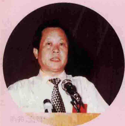
▲ 县委书记曾百友作第七届《县委工作报告》