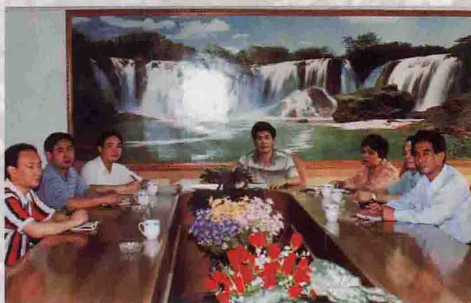
▲ 局领导班子在研究增收节支措施