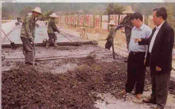
▲ 局领导在工地现场检查指导水泥路施工