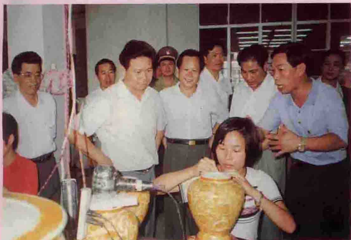
▲ 6月25日，广东省副省长汤炳权在县委、县政府主要领导陪同下视察大埔华艺公司