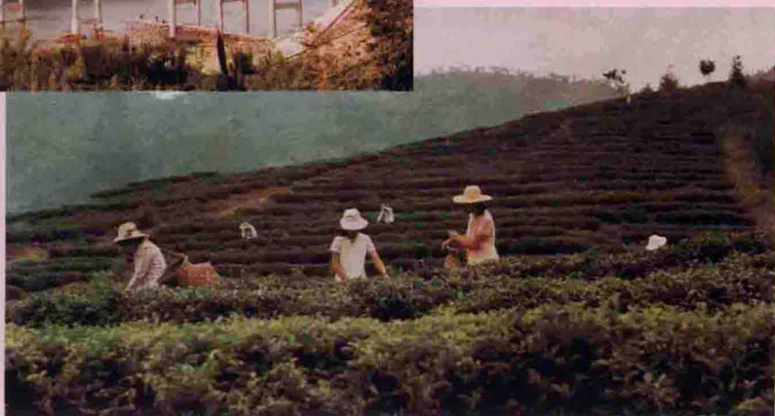
▲ 西岩山茶场一瞥