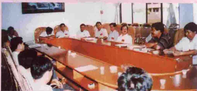
▲ 代表们分组讨论《县委工作报告》(县委办供)