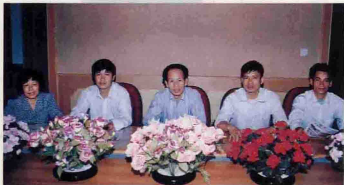
▲ 团结务实的村委班子