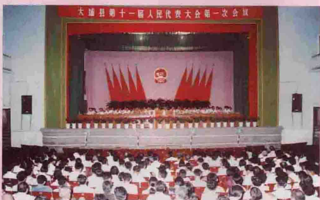
▲ 大埔县第十一届人民代表大会第一次会议于6月9日在县城召开。图为大会会场