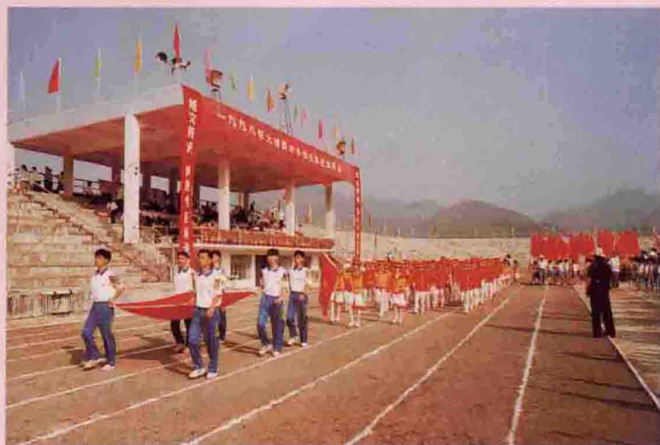
▲ 1998年大埔县中小学生田径运动会开幕式