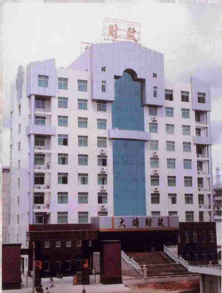
▲ 雄伟壮观的财政综合办公大楼

充满机遇和挑战的1998年，大埔县财政局按照“稳中求进、有效增长”的经济工作方针，紧紧围绕人大通过的预算计划，继续实行适度从紧的财政政策，团结在局党总支周围，劲往一处使，众志成城，充分挖掘增收潜力。全年完成地方本级财政一般预算收入4618.2万元，比增645.9万元，增长16.26%，增幅居全市第二。完成县本级财政一般预算支出20328.1万元，比增1862.3万元，增长10.08%。财政收支目标的实现，为全县的社会稳定和经济可持续发展奠定了坚实的经济基础。