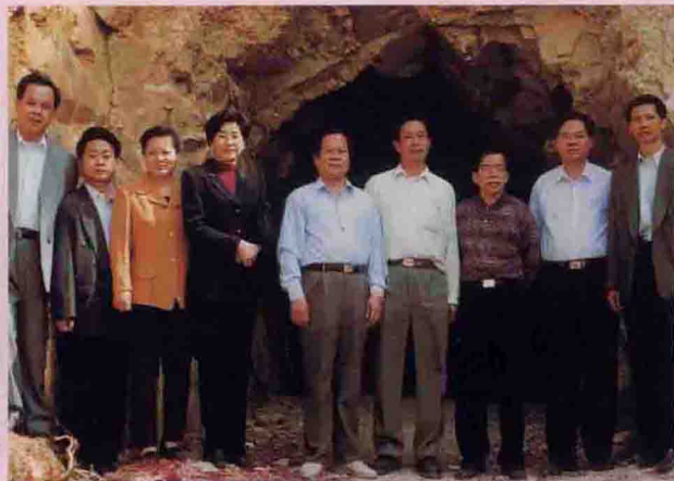
▲ 中央电视台、中国国际电视总公司《嫂娘》剧组开机仪式