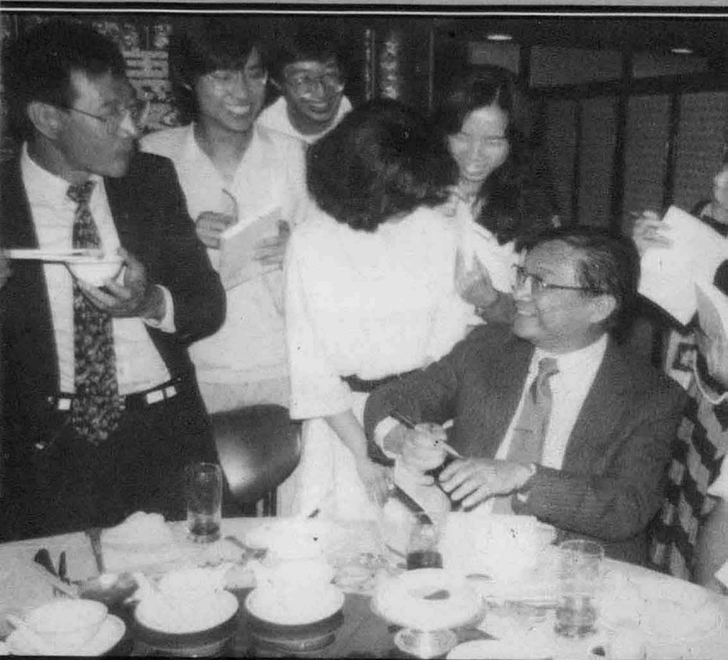
金庸與倪匡在「明報」銀禧餐會上