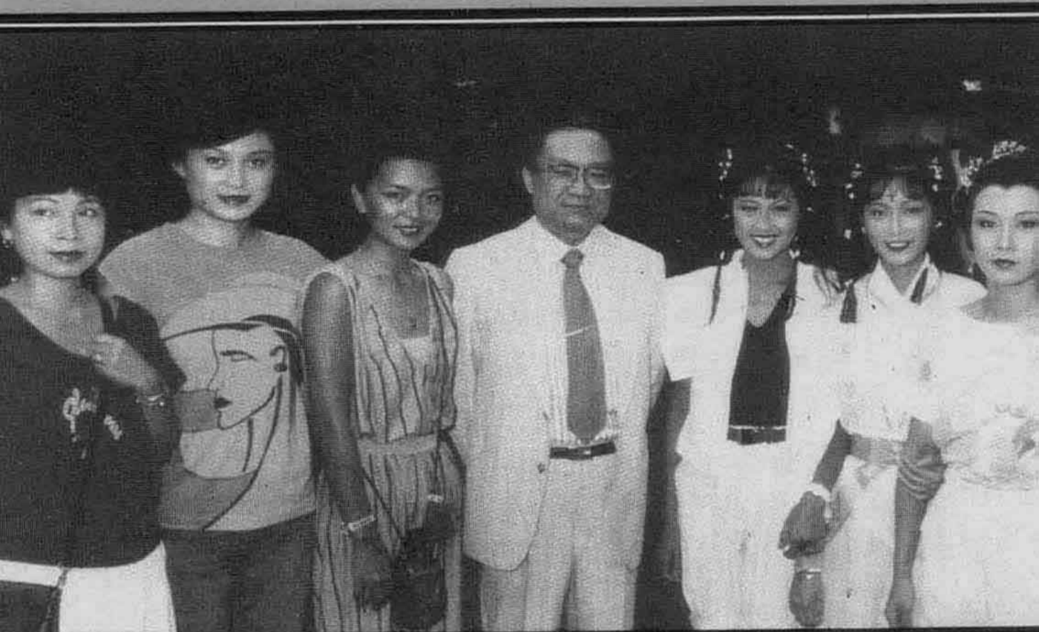
└ 金庸與電視劇“神雕俠侶”女明星合照