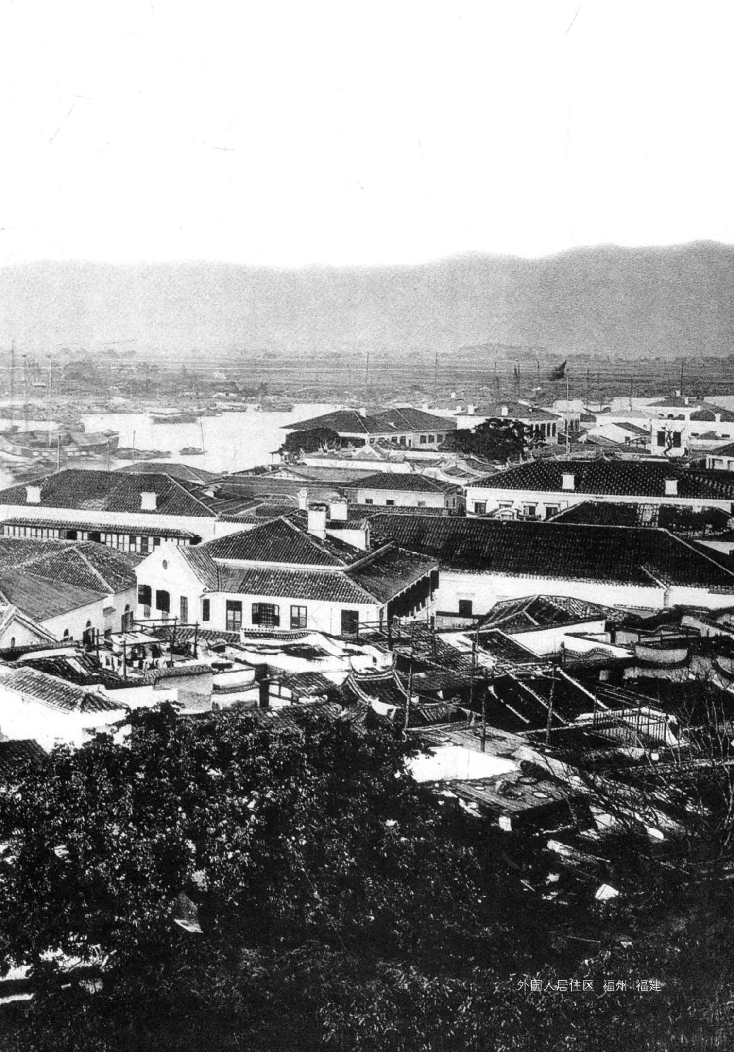
外国人居住区 福州·福建