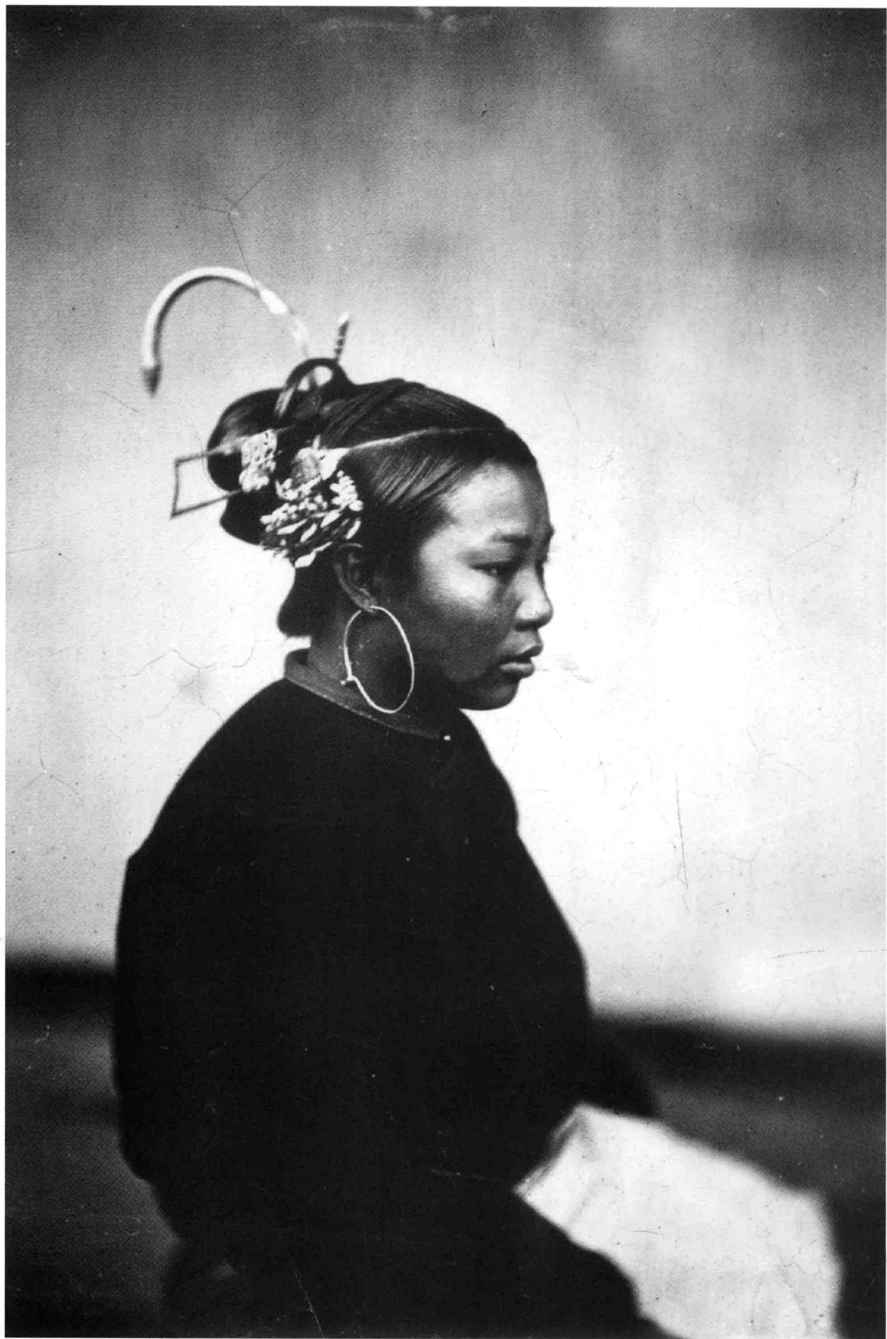
妇女半身侧面像 福州 福建