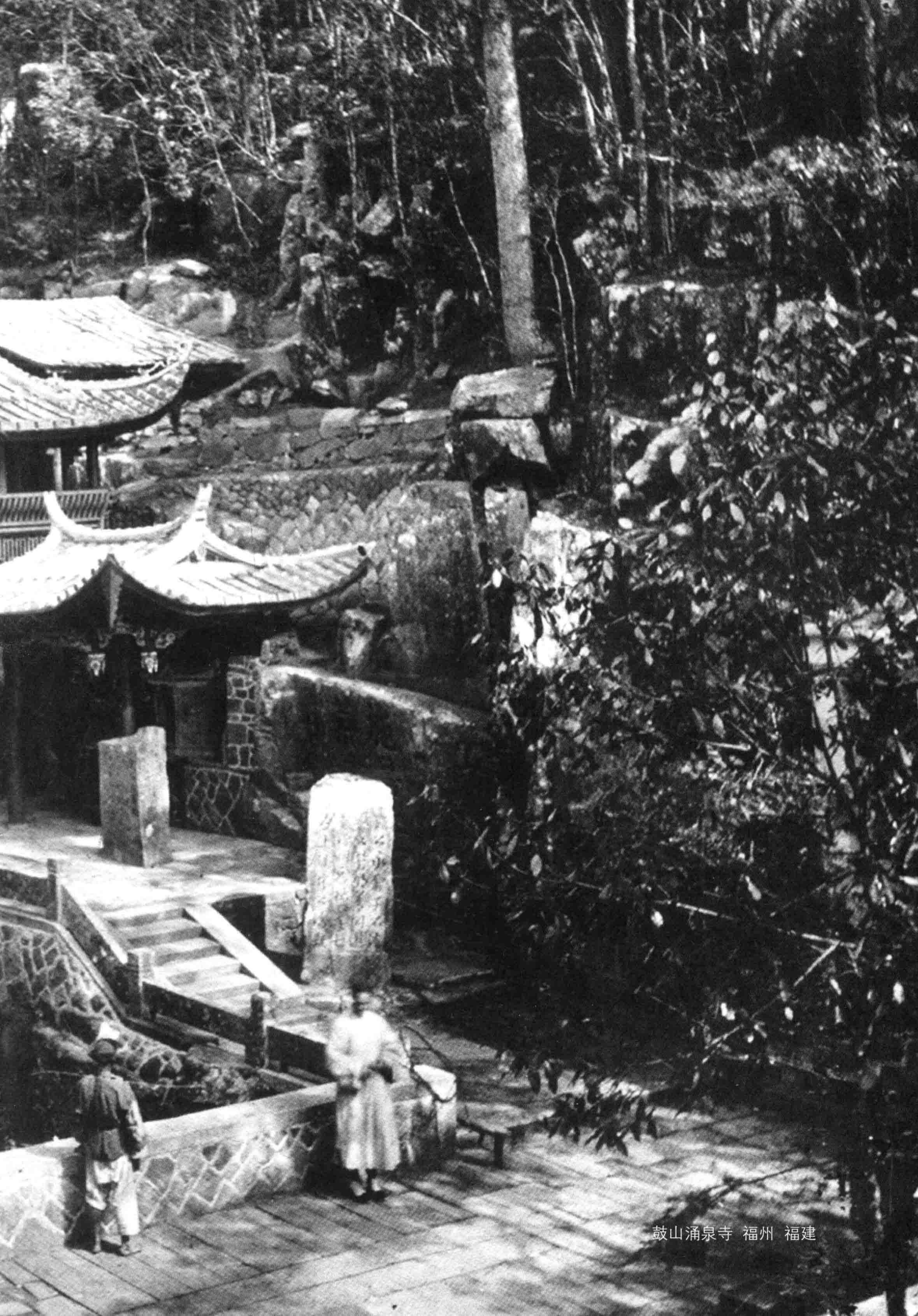
鼓山涌泉寺 福州 福建