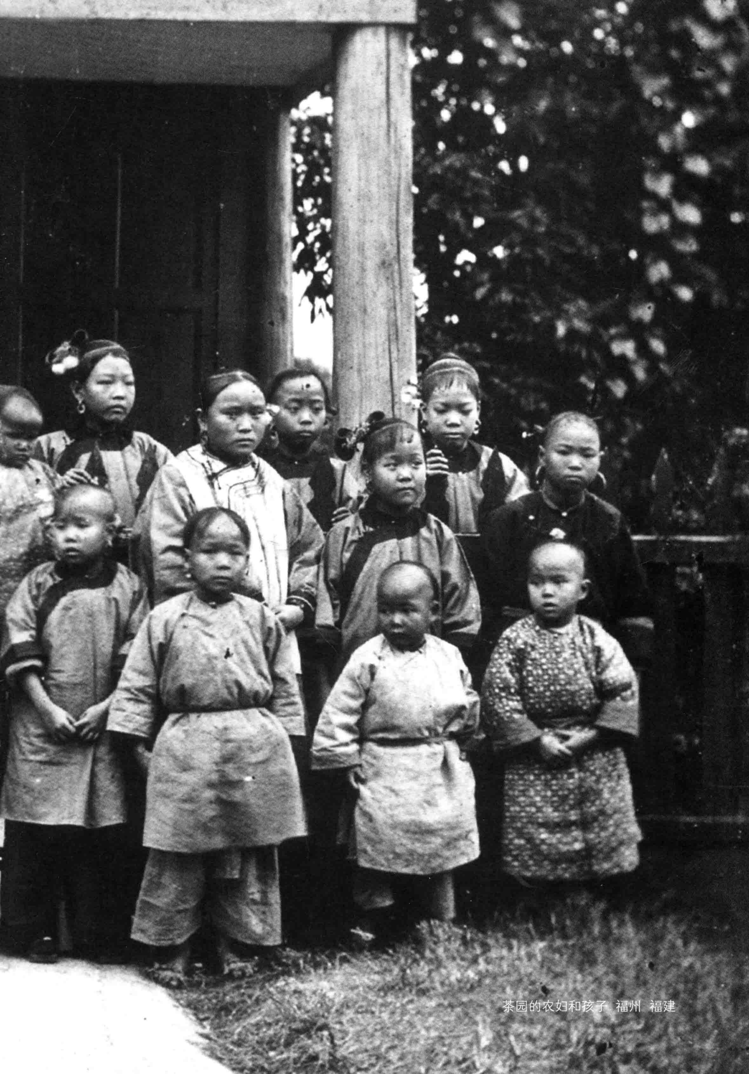
茶园的农妇和孩子 福州 福建