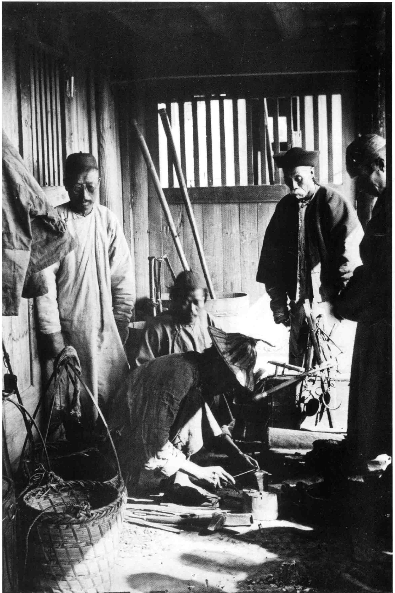
铜匠铺和工匠 福州 福建