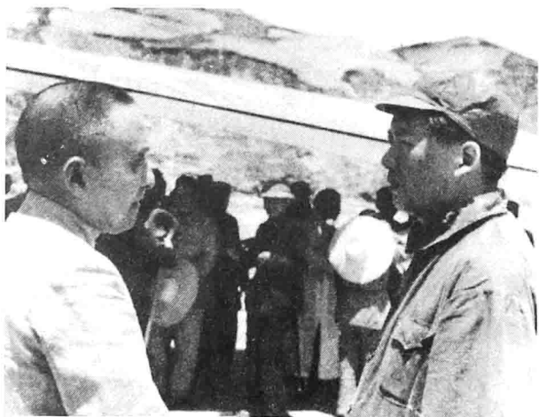
1945年7月1日，毛泽东欢迎黄炎培等民主人士来延安参观

宾主相见，格外亲切。四年前二人在延安谈话的情景仍历历在目。当时，国民参政员黄炎培访问延安，向毛泽东提出一个十分尖锐的问题：我生六十多年，耳闻的不说，所亲眼看到的，真所谓“其兴也浚焉”，“其亡也忽焉”。一人，一家，一团体，一地方，乃至一国，不少单位没有能跳出这周期率的支配力。一部历史，“政怠宦成”的也有，“人亡政息”的也有，“求荣取辱”的也有。总之没有能跳出这周期率。将来中共诸君掌握了政权，能不能找出一条新路，跳出这个周期率的支配呢？毛泽东充满自信地回答：我们已经找到新路，我们能跳出这周期率。这条新路，就是民主。只有让人民来监督政府，政府才不敢松懈。只有人人起来负责，才不会人亡政息。