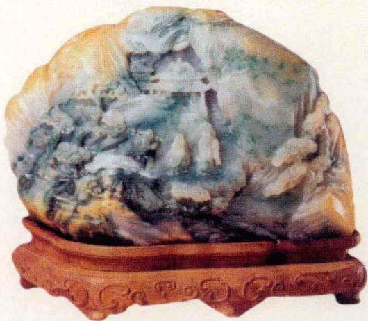
人物山水图山子·清