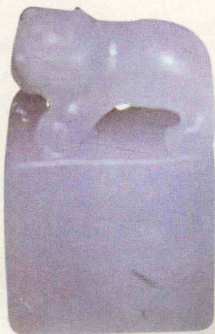
虎纽印章·现代（仿清）