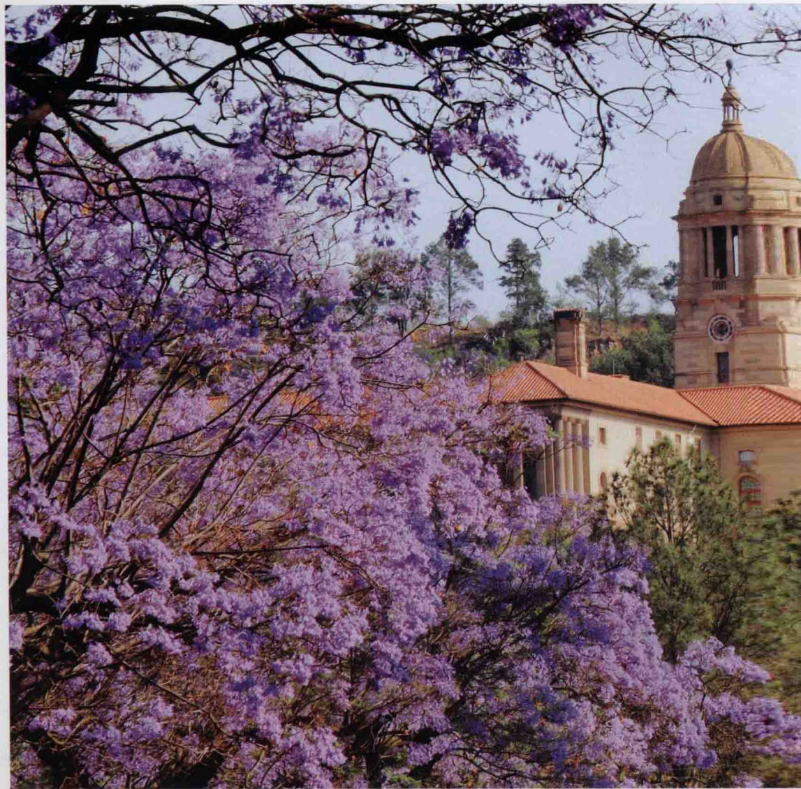
▲怒放的蓝花楹把一座座建筑掩映其中，浪漫的气息让你仿佛置身童话。

伴有淡淡紫蓝，没有灯红酒绿，浮华喧嚣，所有的一切都安静地等待夜幕降临。此时踏着花瓣顺着道路慢慢前行，也不失为一种浪漫。