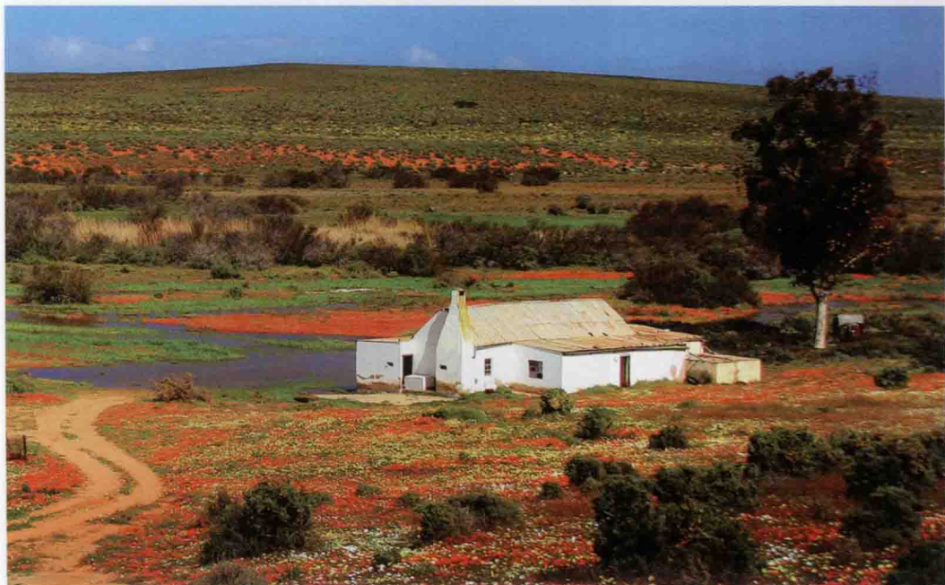
▲ 每逢春季，纳马夸兰总是一片花海盛景，五彩缤纷，香气袭人。

止老鹰、秃鹫、狞猫等天敌的偷袭，它们平日里都将前肢抬起，后肢伸直站立在隐蔽的位置，眼观六路、耳听八方，一旦发现不对劲，便立即尖叫着给同伴报警。