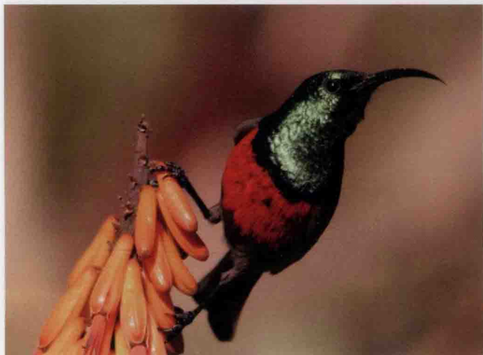
▲ 有着一身红绿相配且色泽油亮的太阳鸟是当地的珍贵益鸟。

每每到了八九月时，这里便是生命繁殖的季节，蜜蜂和蝴蝶们来往于姹紫嫣红中，为它们授粉，创造下一春的美丽。 小巧玲珑的太阳鸟在箭筒树上的花朵间吃着花蜜，传授花粉。