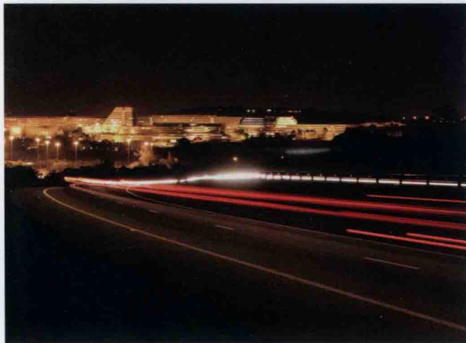
▲ 尽管到了夜晚，比勒陀利亚仍然一片灯火辉煌，处处流光溢彩。

在比勒陀利亚的万千花海之中，最美最奇的要数几乎蔓延整个城市的蓝花楹了，一缕缕望不尽的紫蓝色，一片片飘落纷飞的淡紫色雪花，把春天的比勒陀利亚粉妆成一个紫蓝色的仙境。