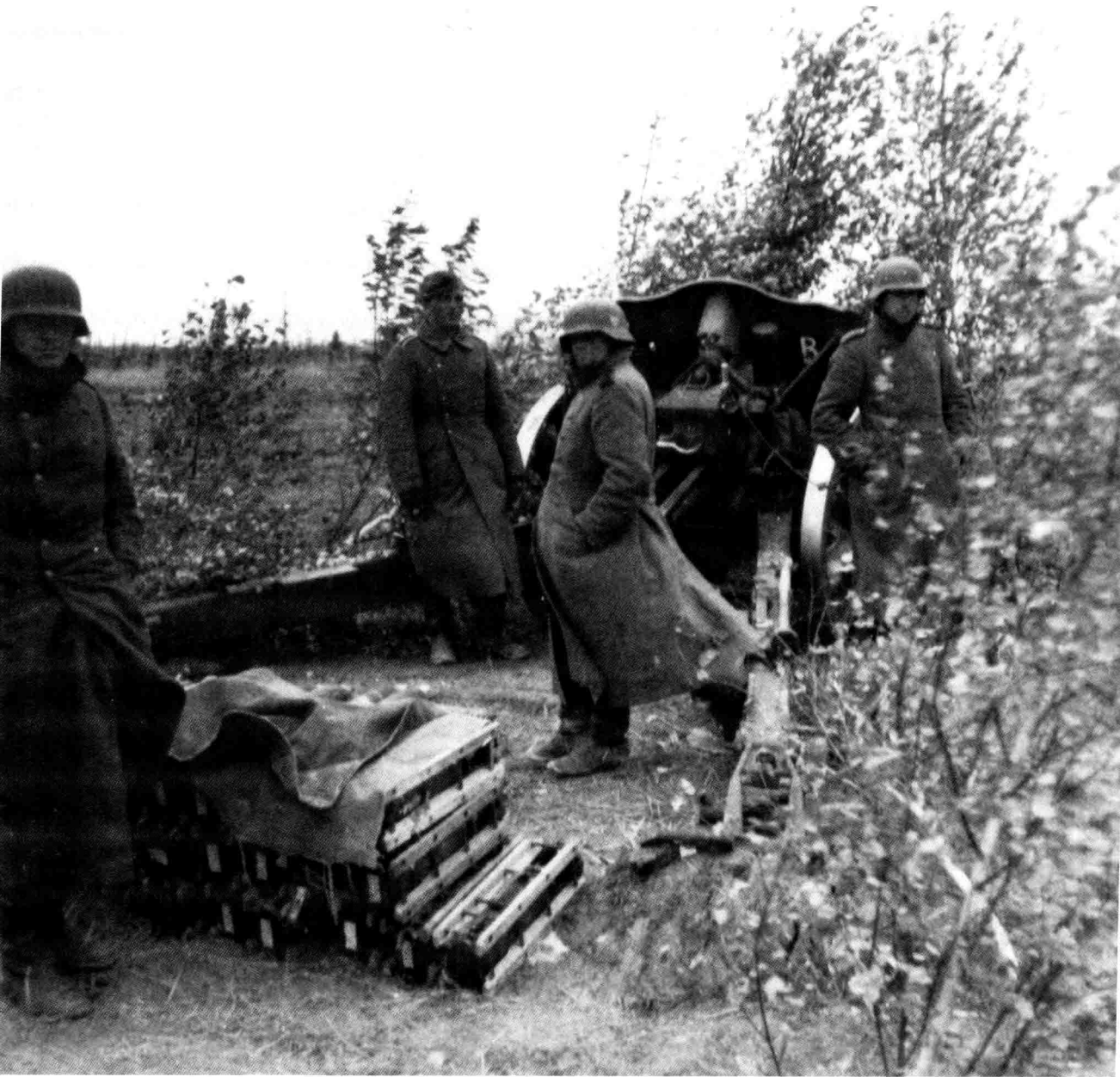
苏联的天气变得愈发恶劣，轴心国领导人不得不重新考虑东边的作战计划。图中为一队使用105毫米自行榴弹炮的士兵在等待军令。105毫米自行榴弹炮是德国纳粹国防军的镇军之宝，它的射程是12200米，射击速度是每分钟8发炮弹。