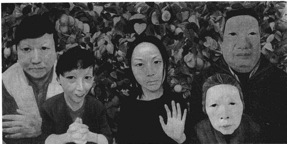
图2 《未完成的养老》插图

那个巨大的可能性就在于付达信本人，只有采访到他，才能获得更多细节和新的故事，比如——他在狱中过得怎样，真的过上了老有所养的生活吗？