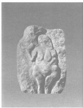
图1 石雕女像，旧石器时代晚期，法国南部出土

工艺文化在人类社会的发展过程中，出现的历史悠久。当人类诞生以后，在长期的劳动生产实践中，针对生产和生活的用途，制造相应的工具和容器，或者利用动物的骨骼制作装饰品，从而出现了原始的工艺品，并赋予一定的文化含义。如早在旧石器时代晚期，原始工艺品就以雕塑的形式出现。在法国发现了石雕女像、角制飞马、骨制猛犸象、象牙雕女孩像等原始工艺品。石雕女像以悬垂的胸部、突出的腹部和肥臀，强调女性的基本造型，从美的角度来看，其胸部和臀部的曲线优美，很难想象是由几万年前的类制造出来的（图1）。角制飞马，以鹿角作