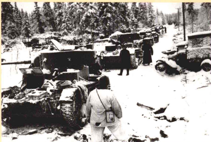
◀1940年1月17日，芬兰军队刚刚打败了苏军一个师，展示缴获的战利品。

则身穿褐色的服装，在一片白茫茫的雪原中分外的显眼，也很自然地成为了最好的靶子，伤亡之大也就很自然了。这