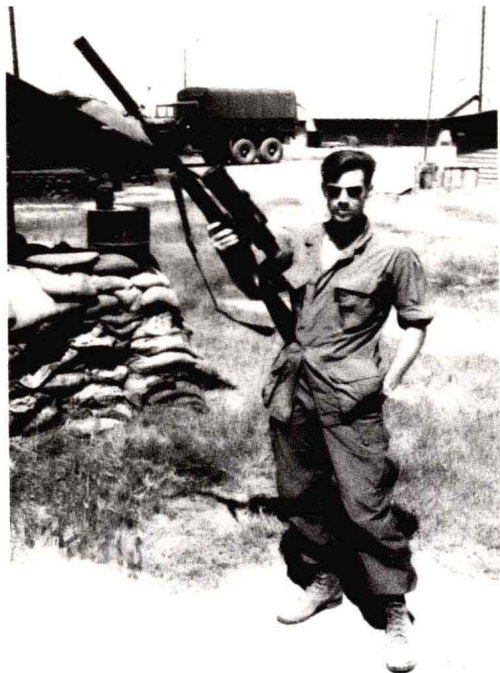
▲装了消声器和微光瞄准镜的美国M21狙击步枪