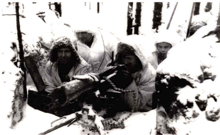
► 芬军利用严寒和沼泽森林的有利地形，展开反击战、阵地战和消耗性围歼战。

城市维堡在内的卡累利阿地峡、萨拉地区和芬兰湾的大部分岛屿割让给苏联，并把汉科港租给苏联三十年。有历史学家说，芬兰虽然割让了1/10的领土，但通过战争避免了与其他波罗的海国家一