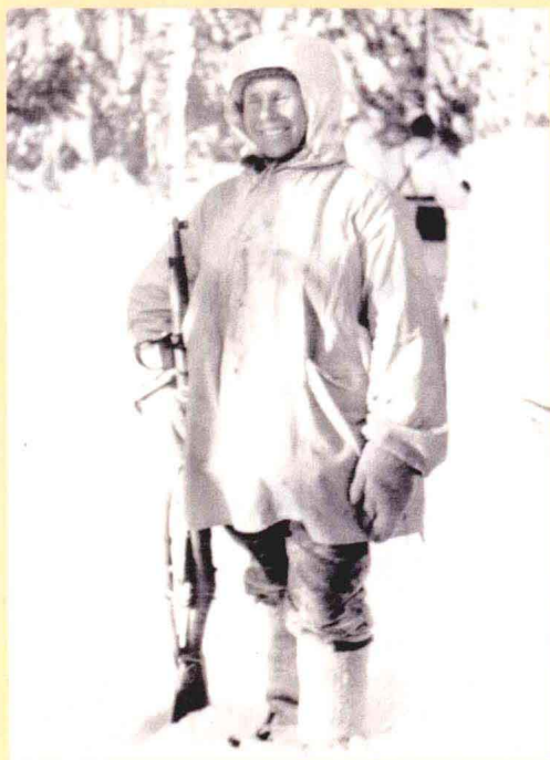
▲世界头号狙击手——西蒙·海耶。苏芬战争中，他带领狙击小组，身着白色伪装服，穿梭于大雪封山的荒郊野外，隐藏在丛林深处，不断射杀行进中的苏军士兵，给他们造成了极大的威胁和巨大的伤亡，苏军士兵惊恐地称他为“白色死神”。

则身穿褐色的服装，在一片白茫茫的雪原中分外的显眼，也很自然地成为了最好的靶子，伤亡之大也就很自然了。这