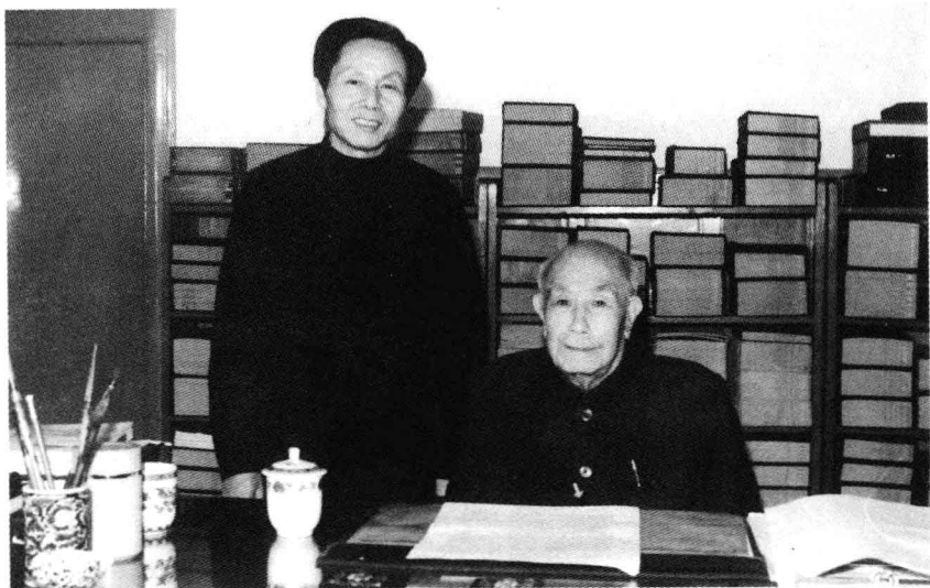
■ 1993年，吴德与访谈者朱元石合影。

届十二中全会上递补为中央委员。1972年后，任中共北京市委书记、北京市革命委员会主任，北京卫戍区第一政治委员，北京军区政治委员。1969年、1973年分别在中共第九次、第十次全国代表大会上当选为中央委员，是第十届中央政治局委员。是第四届、第五届全国人大常委会副委员长。现在根据1993年的访谈整理出来的这本吴德口述史，一共集有13篇，并不是依谈话顺序的先后，而是大致按所谈事情的历史时间先后编排的，都是他在十年“文革”风雨中所经历的一些重大事件。我们整理出来后都经吴德同志看过，并在大多篇章上留下了他的修改文字。作为历史工作者，我们希望这本口述史，能为国史研究者提供严谨和宝贵的一方记录。