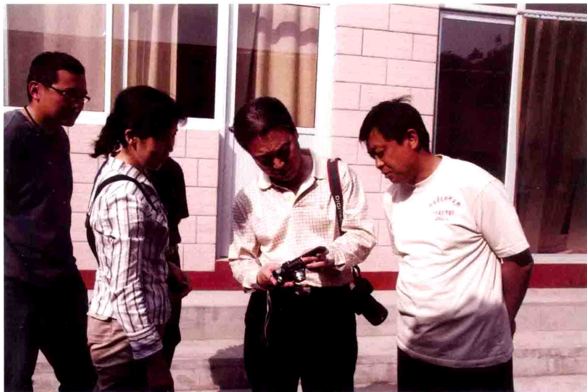
看看你拍的长城图片