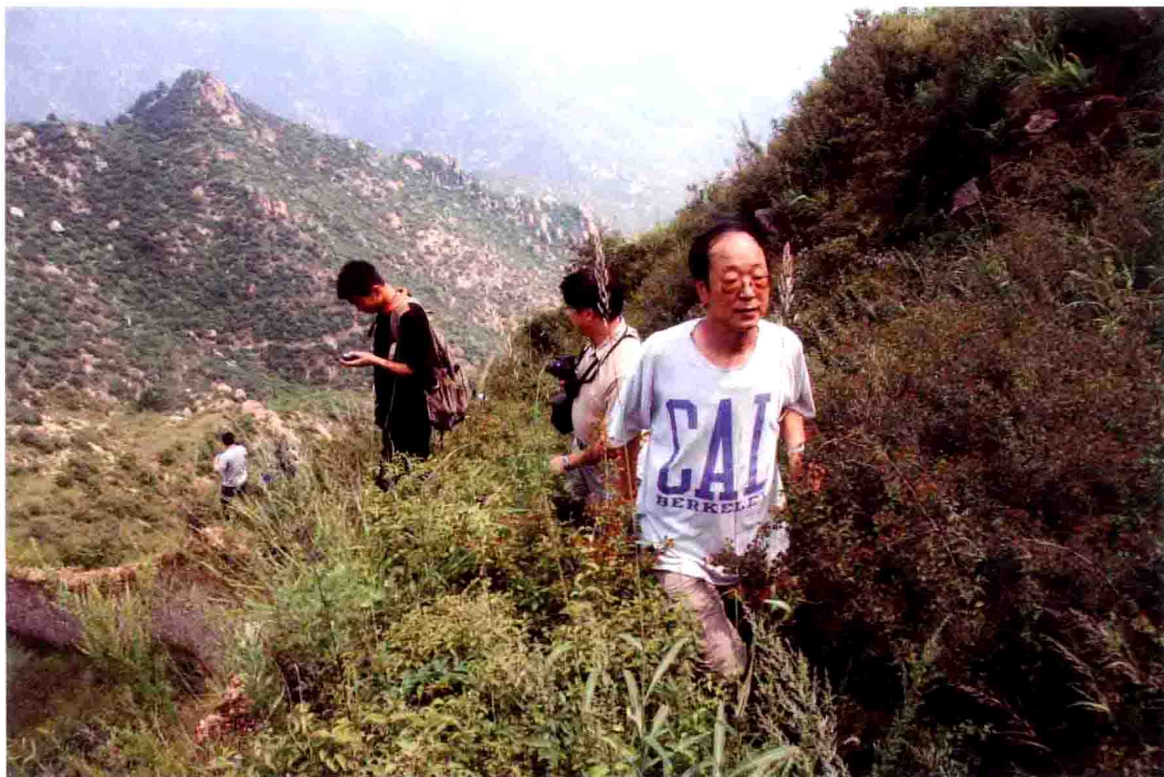
河北省文物局谢飞副局长亲自登上长城看望调查队员们