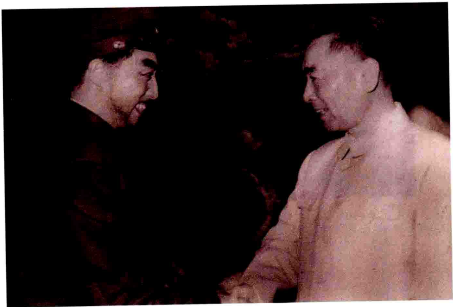
周恩来总理祝贺《红灯记》演出成功