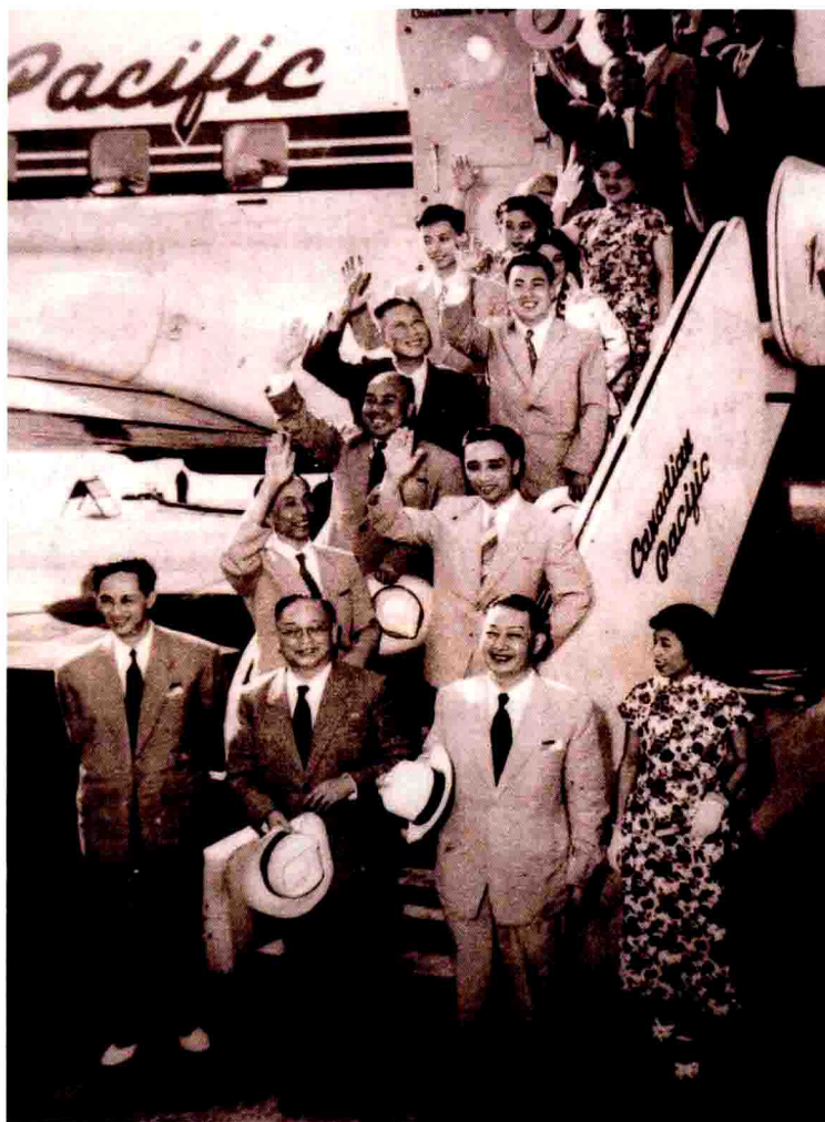
1956年5月, 李少春随中国京剧访日代表团抵达东京 (左起) 前排中为欧阳予倩、梅兰芳, 二排为马少波、李少春, 三排为袁世海, 四排为姜妙香、李和曾