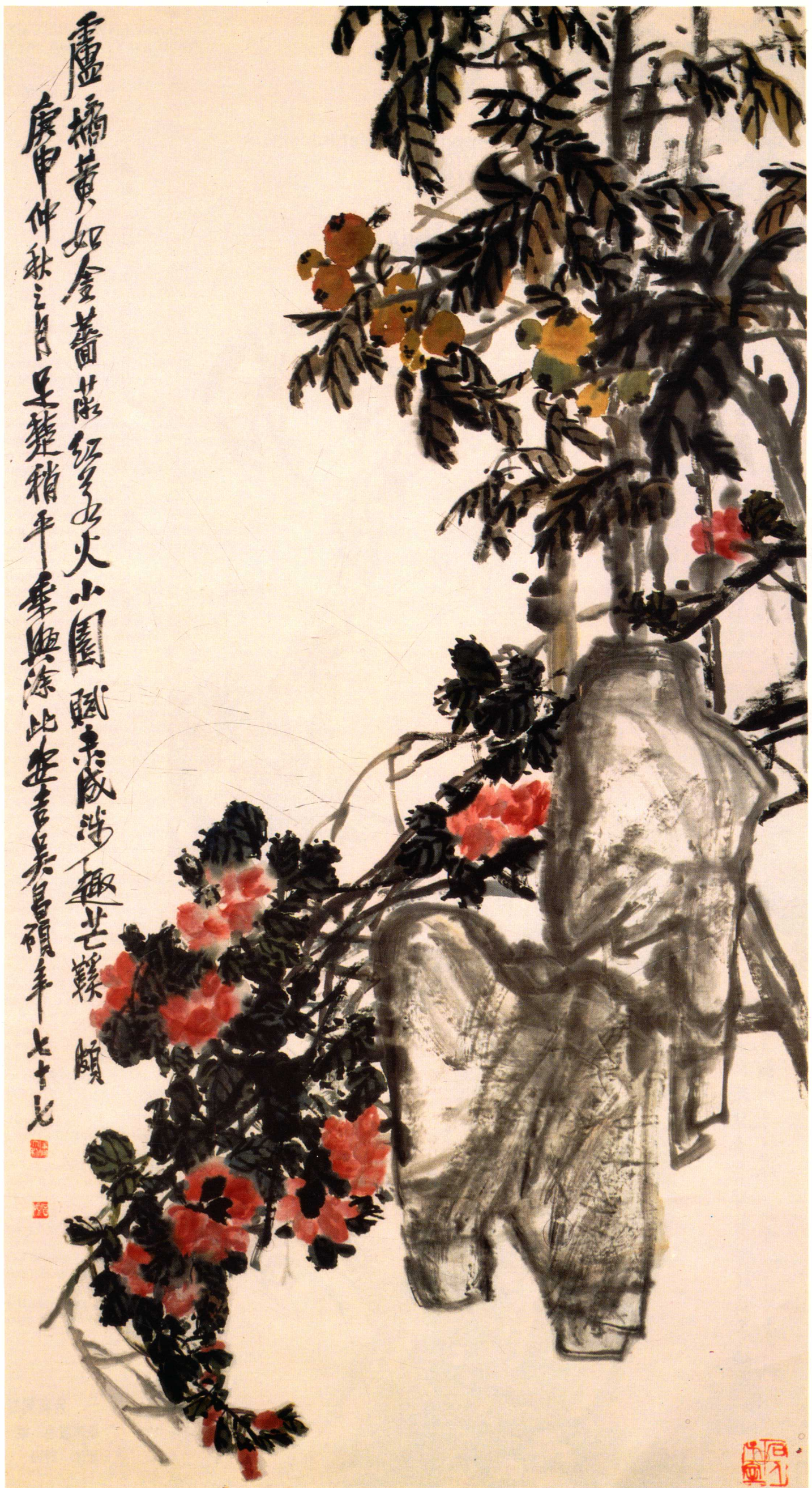
四 薔薇蘆橘圖軸 (清) 吳昌碩 紙本設色 縱一五四·一 橫八二·八厘米