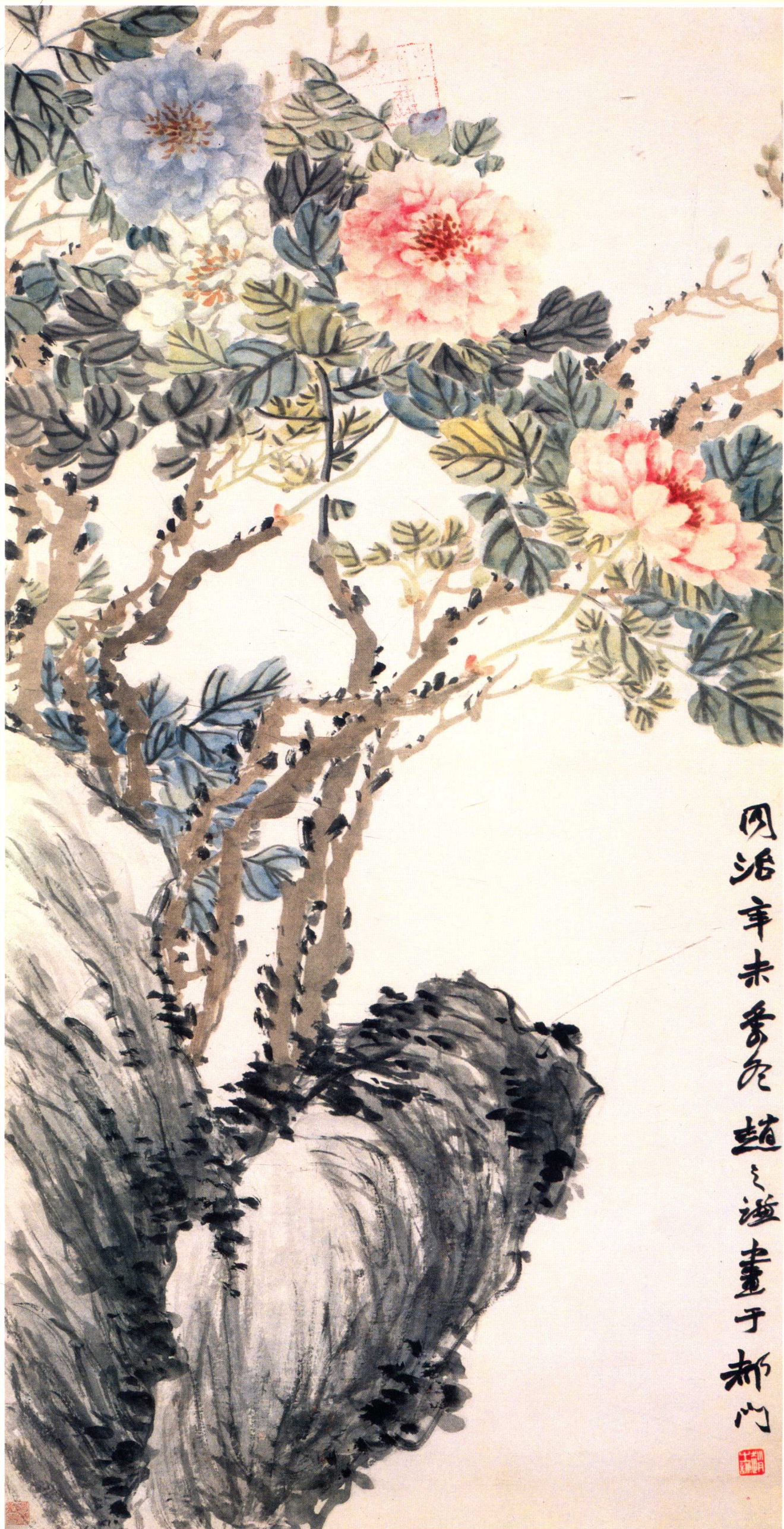
二 牡丹圖軸 (清) 趙之謙 紙本設色 縱一三六