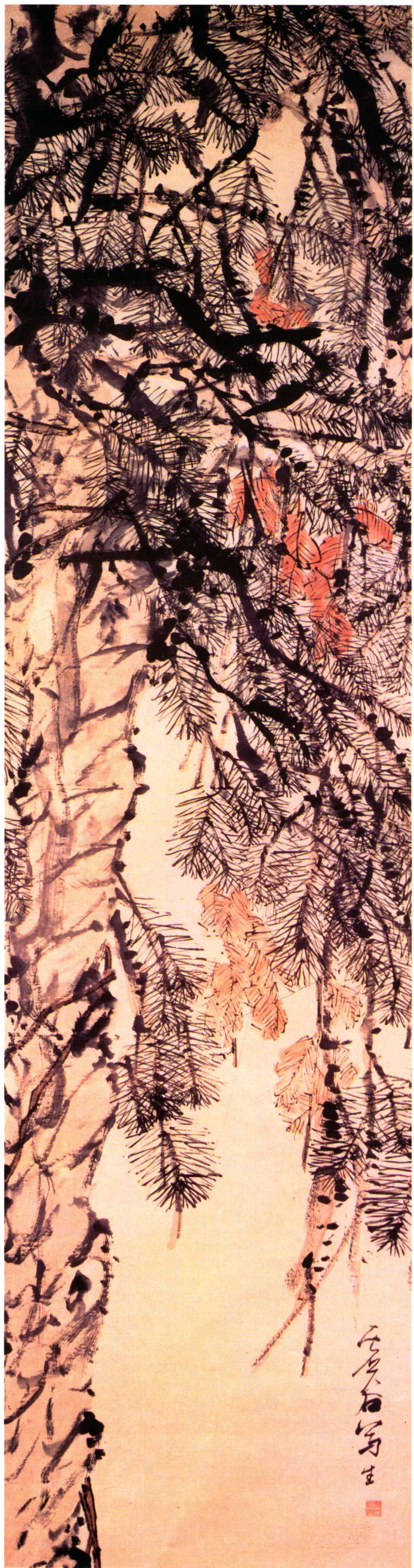
一三 松圖軸（清） 虛 谷 紙本設色 縱一一四 橫六〇·五厘米