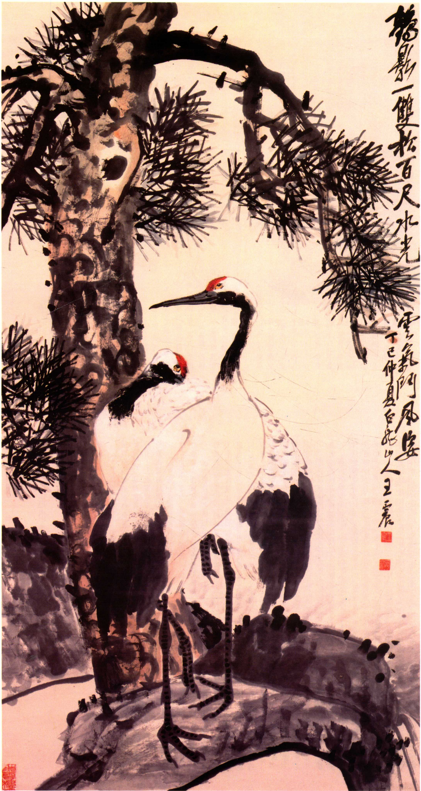
一一 松鶴圖軸 (清) 王震 紙本設色 縱一七八 橫九五厘米