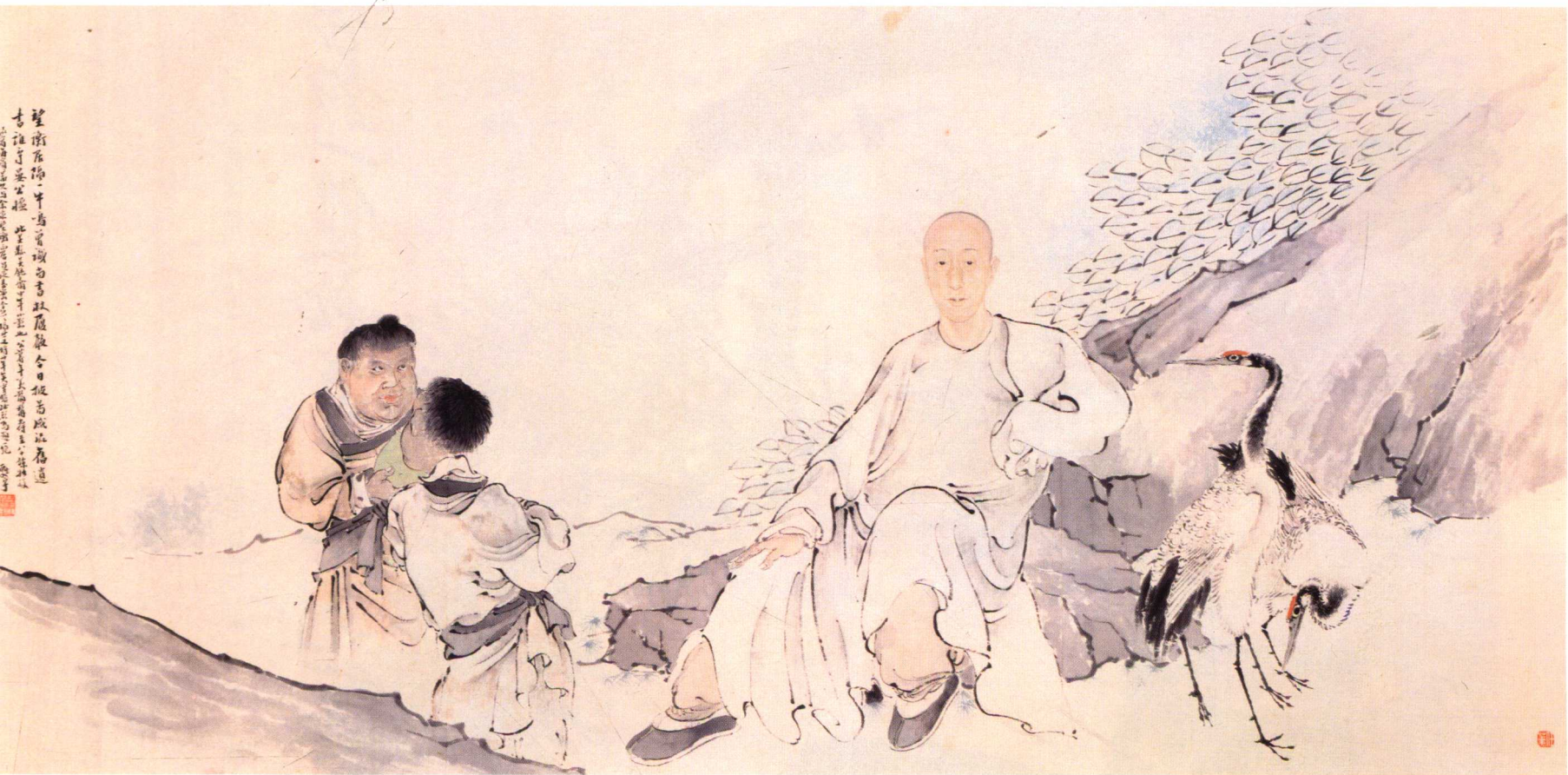
一二 吳純齋影橫軸 (清) 任薰 紙本設色 縱六六·二 橫一三六·五厘米封面