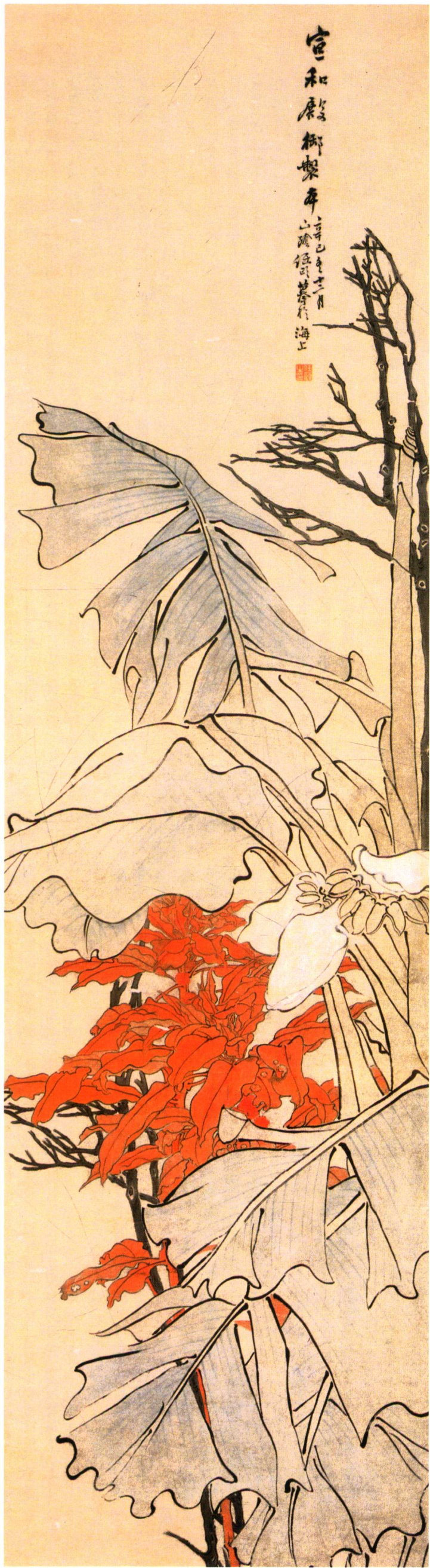
一四 芭蕉紅葉圖軸（清） 任 頤 紙本設色 縱一七九·五 橫四七厘米