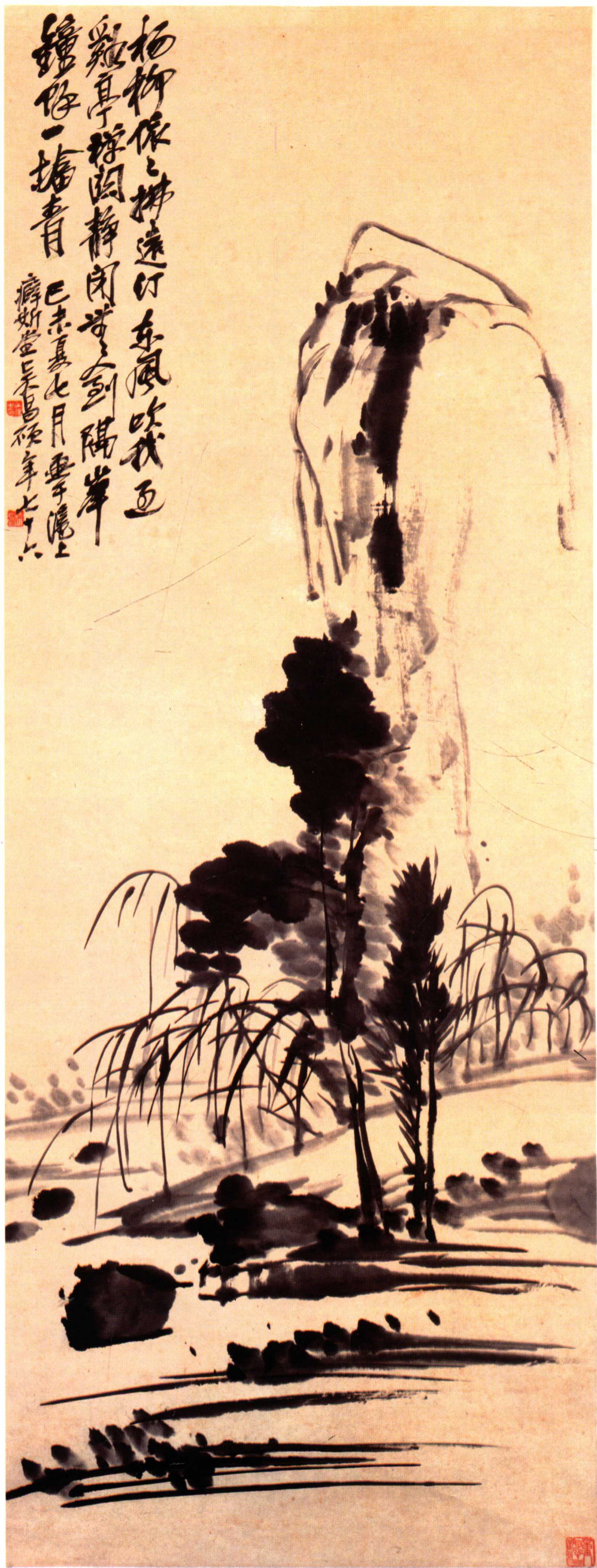
一五 水墨山水圖軸（清） 吳昌碩 紙本水墨 縱一三六·九 橫五二·四厘米