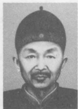
邓小平的父亲 邓文明的画像。

邓文明精力充沛，开明乐观，热心地方公益。在邓小平离开家以后的一段时间里，邓文明一度曾成为广安及周边地区颇有影响的人物。他指挥过数百人的民军，当过广安县的警卫总办（又称团练局长）。牌坊村一些还记得邓文明的老人曾对外国游客介绍说，