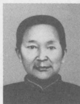
邓小平的母亲淡氏的画像。

邓文明后来又结过两次婚。他的第三个妻子姓萧，为他生了一个儿子（四子）。第四个妻子夏伯根是嘉陵江船工的女儿。夏氏只比邓小平大一岁 ② ，她为邓