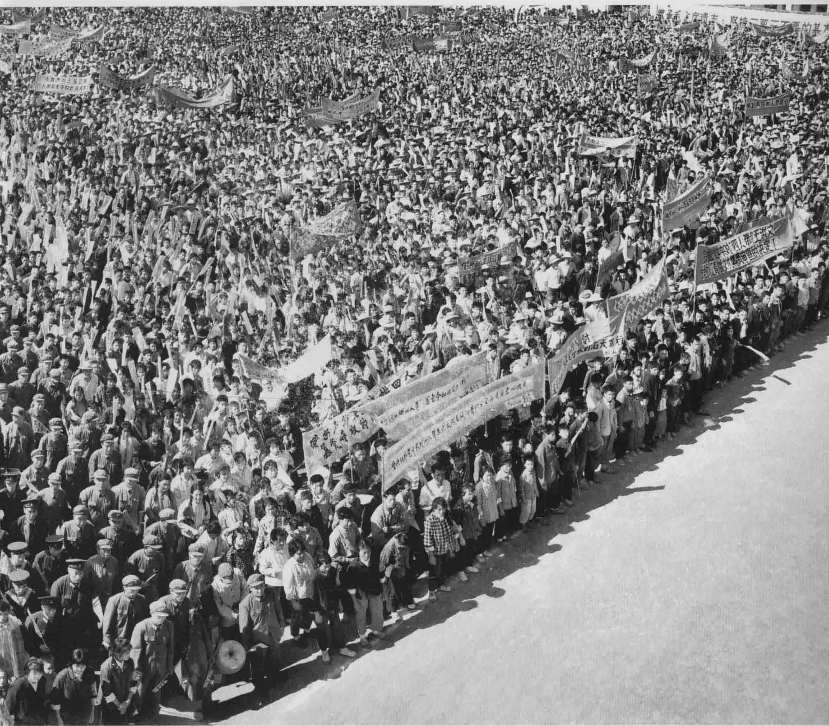
1976年10月，党中央一举粉碎了江青、王洪文、张春桥、姚文元“四人帮”反革命集团，结束了“文化大革命”这场十年动乱。全县数万群众在黄岩中学操场集会，欢庆伟大胜利。（摄于1976年）