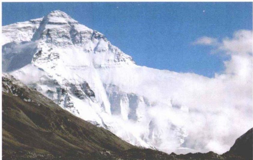
① 世界第一高峰——珠穆朗玛峰

雄伟的喜马拉雅山脉,雪峰林立,其中珠穆朗玛峰耸立在群峰之中,高达8844.43米(据2005年最新测量数据),为世界第一高峰。峰顶的气温终年在零下30℃至零下40℃,空气稀薄,狂风怒吼,风吹积雪,四溅飞舞,弥漫天际。珠穆朗玛峰曾被称为飞鸟也难以逾越的天险。然而,1960年,我国登山运动员和科学工作者不畏艰险,克服重重困难,首次