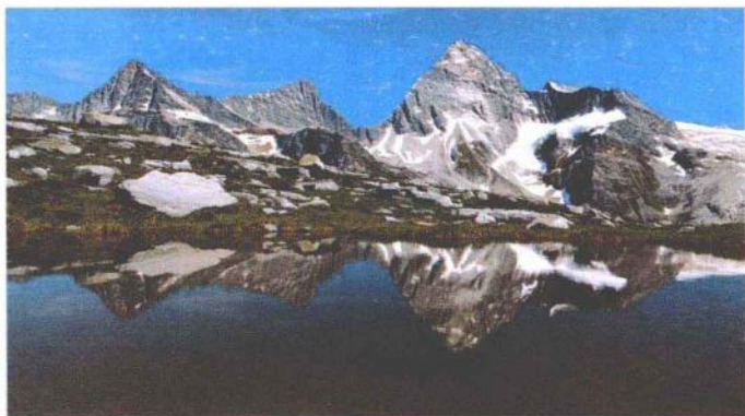
④ 青藏高原上的湖泊

青藏高原是由一系列高大山脉组成的高山“大本营”。喜马拉雅山屹立在大高原的南缘，莽