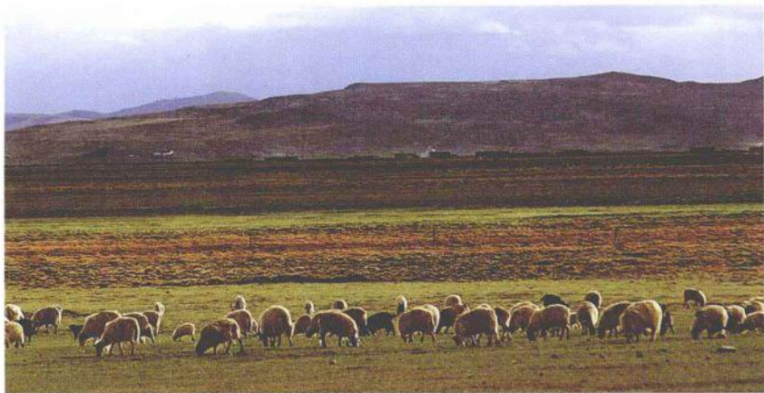
❶ 青藏高原广阔的草原地带，牛羊成群。

莽的昆仑山脉挺立在大高原的北边，山高谷深的横断山脉紧挨在大高原的东面，它们犹如铜墙铁壁，兀立在大高原的四周。可可西里山、巴颜喀拉山、喀喇昆仑山、唐古拉山、冈底斯山和念青唐古拉山等一系列高大山脉，整齐地排列在大高原的内部。这些山脉的平均海拔大多在 5000 米以上。