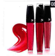
04-08 化妆品中的色彩运用