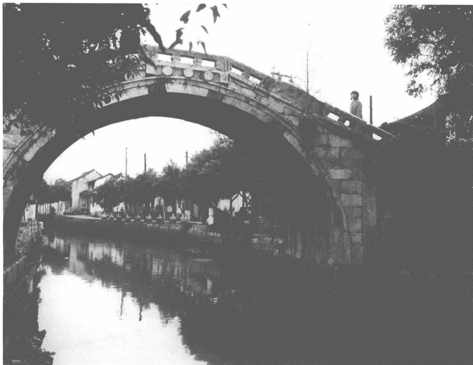
陈云的故乡——上海市青浦县练塘镇