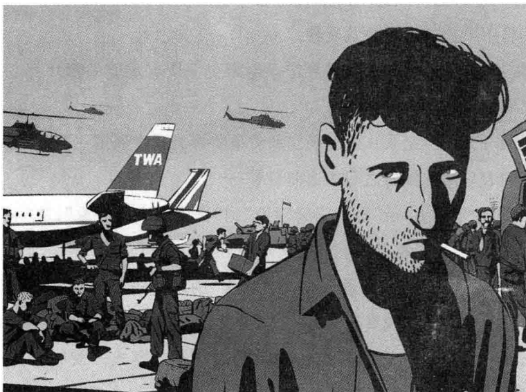
图2 《与巴赫尔跳华尔兹》( Waltz With Bashir )

关于纪录片是否需要重新定义的讨论尚无定论,2008年,一部新的作品又将纪录片的边界向外推进了非同凡响的一步,这是一部几乎完全以动画形式构成的作品。2008年《与巴赫尔跳华尔兹》( Waltz With Bashir )获得世人瞩目,以色列导演阿里·福尔曼19岁时作为以色列士兵亲眼目睹了1982年黎巴嫩贝鲁特萨巴拉与沙提拉巴勒斯坦难民营大屠杀。二十多年后,失忆的福尔曼通过与当年的战友、朋友、心理医生和亲历惨案的军人、记者的对话,试图回忆起屠杀的真相。随着福尔曼的记忆被逐步唤起,1982年黎巴嫩战争的惨相逐帧在作品中浮现。