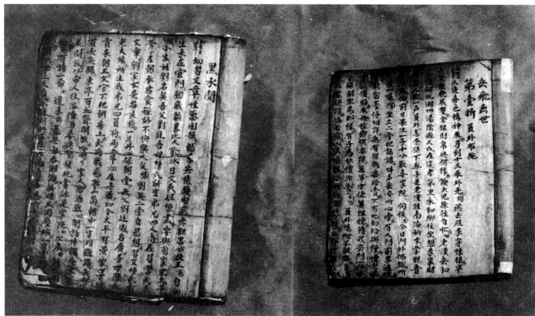
吹吹腔抄本（清光绪年间）

民国年间，白族群众在迎神赛会、婚丧嫁娶中，经常性地演唱吹吹腔戏，但均为业余性组织。