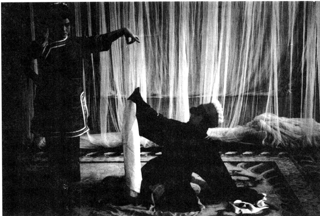
吹吹腔《火烧磨房》演出场景