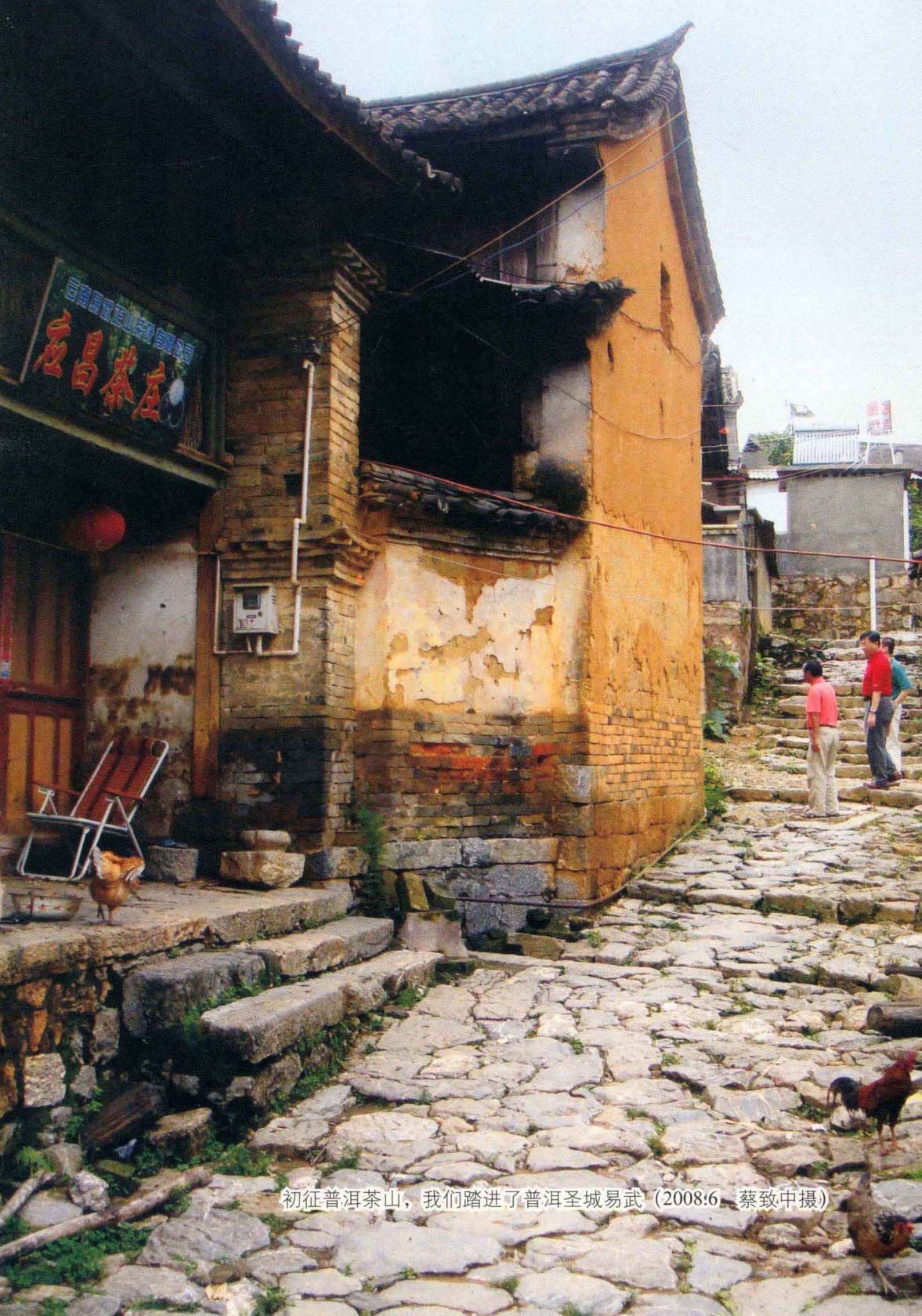
初征普洱茶山，我们踏进了普洱圣城易武（2008.6，蔡致中摄）