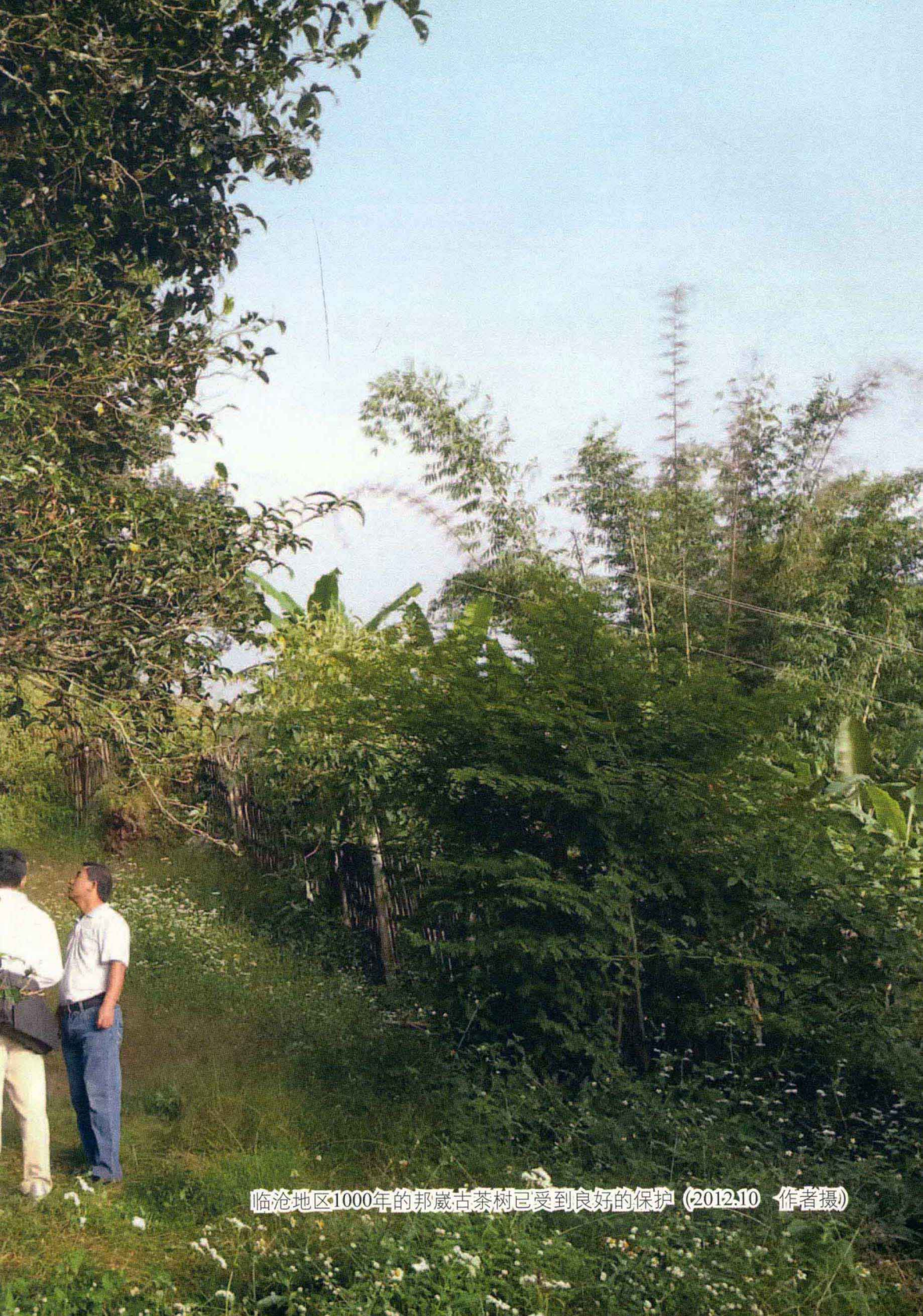
临沧地区1000年的邦崴古茶树已受到良好的保护 (2012.10 作者摄)