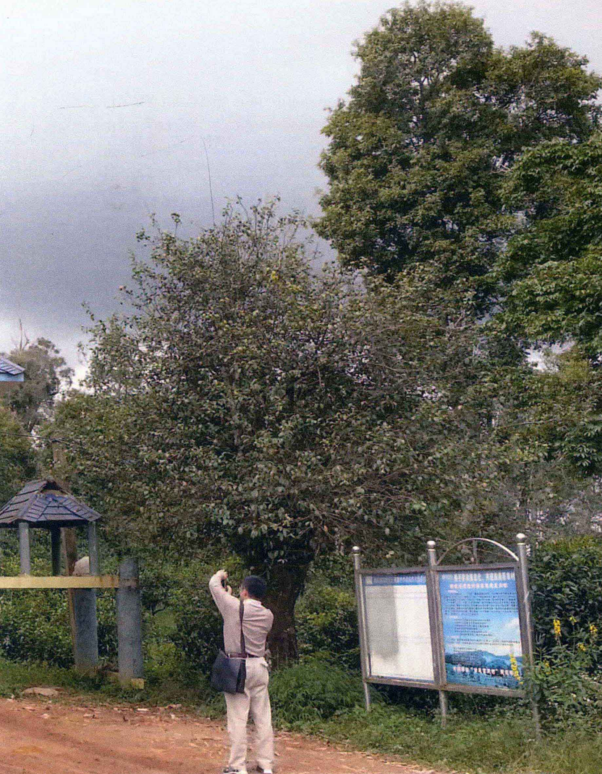
翻山越岭，穿过泥泞与坑洞，我们总算到了老班章寨子（2012.10）