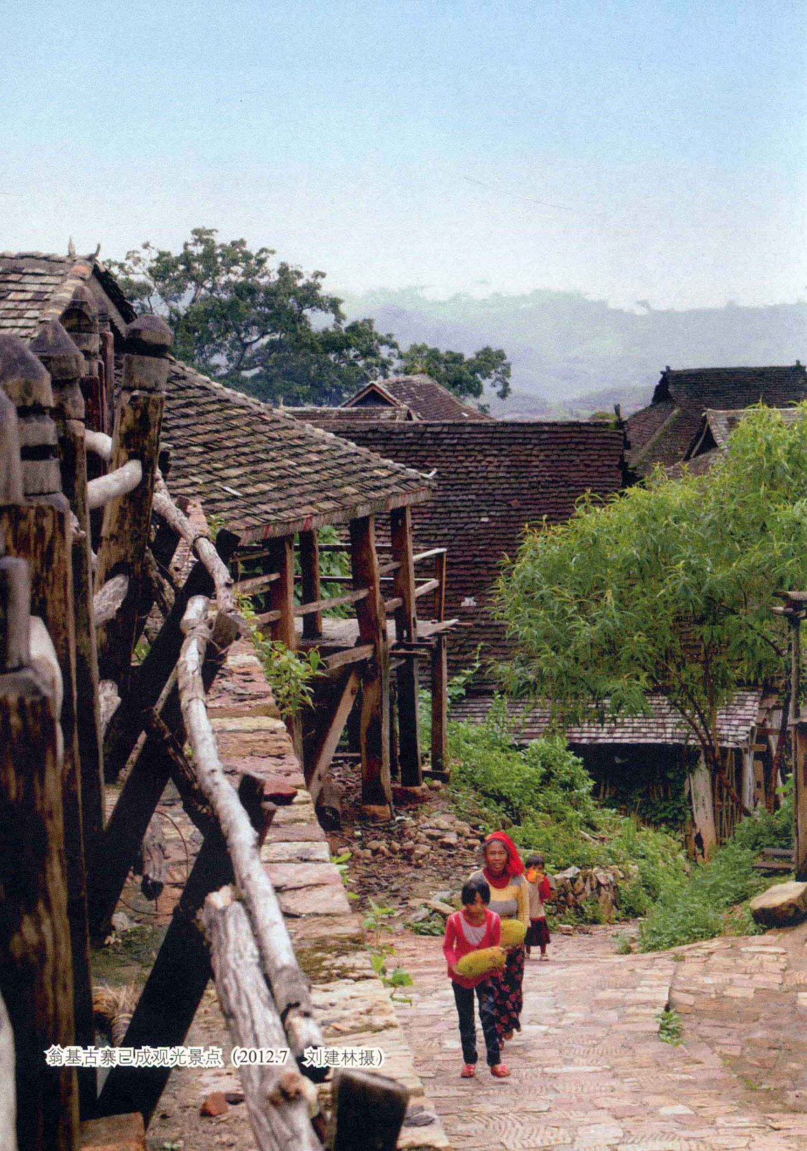
翁基古寨已成观光景点 (2012.7)