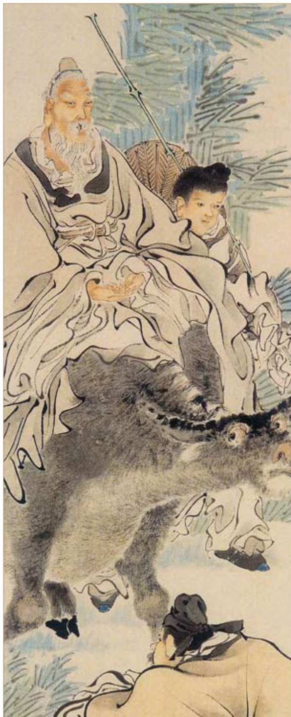
清·任伯年·老子授经图