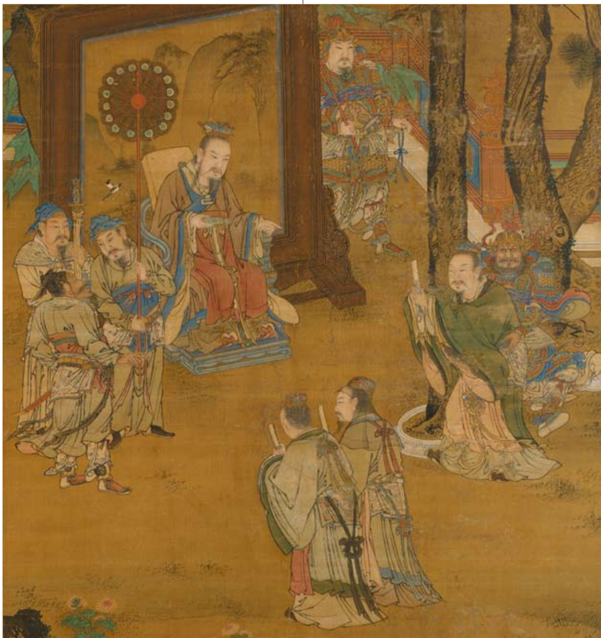
明·刘俊·汉殿论功图

掌管礼乐教化，倕管理工匠，伯夷掌管宗庙祭祀，皋陶掌管刑狱，益掌管狩猎。这些具体的事情，尧一件也不做，可为什么他能做帝王，而这9个人却心甘情愿做臣子呢？因为尧知道这9个人各自有什么才能，然后量才使用，让他们个个成就一番事业。尧凭借这9个人