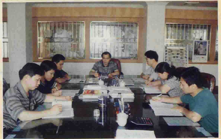
▲ 政府采购中心在研究行政事业单位办公用品定点招标方案