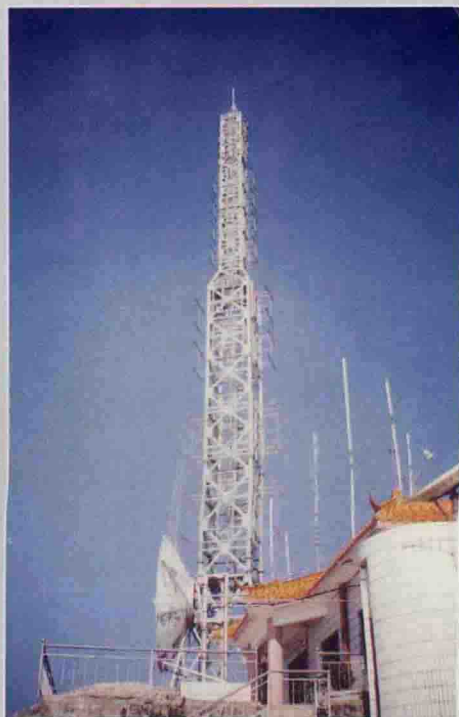
▲ 总投资70多万元，高52米 的大帽山顶广播电视发射塔