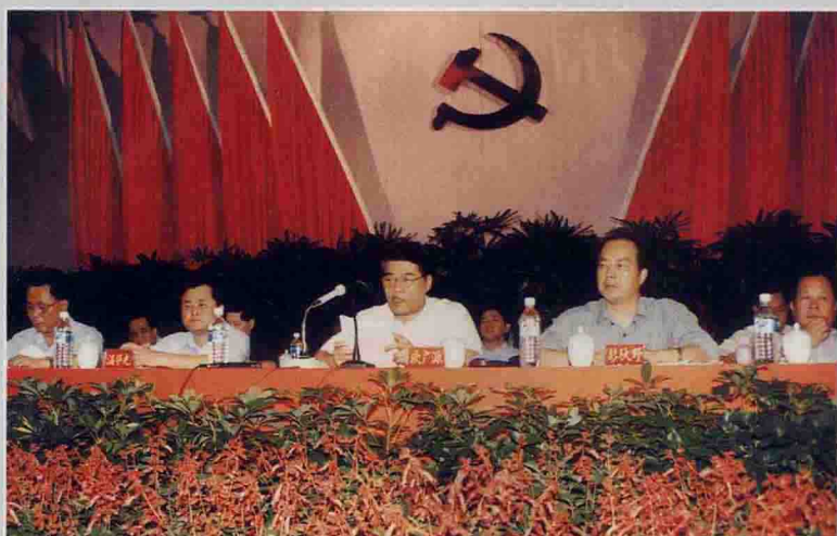
◀ 省委常委、副省长欧广源在县级领导班子领导干部“三讲”教育动员大会上作重要讲话