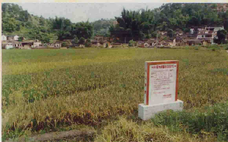
▲ 农田保护区水稻丰收在望