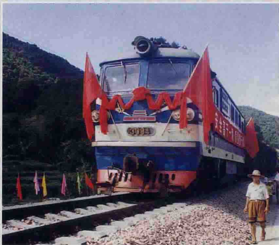
▼ 6月26日，梅坎铁路全线贯通，“北京”号专列首次开进大埔