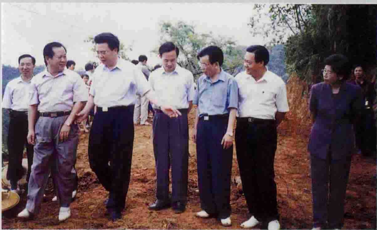
▲ 7月19~20日，梅州市委书记谢强华（左3）来埔调研。图为视察湖寮镇长新村“两大战役村村通公路”现场