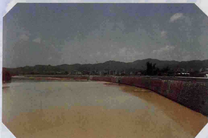
▲ 县城环城大道防洪堤一瞥