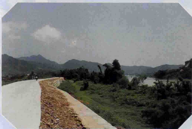
▲ 三河汇城防洪堤一角