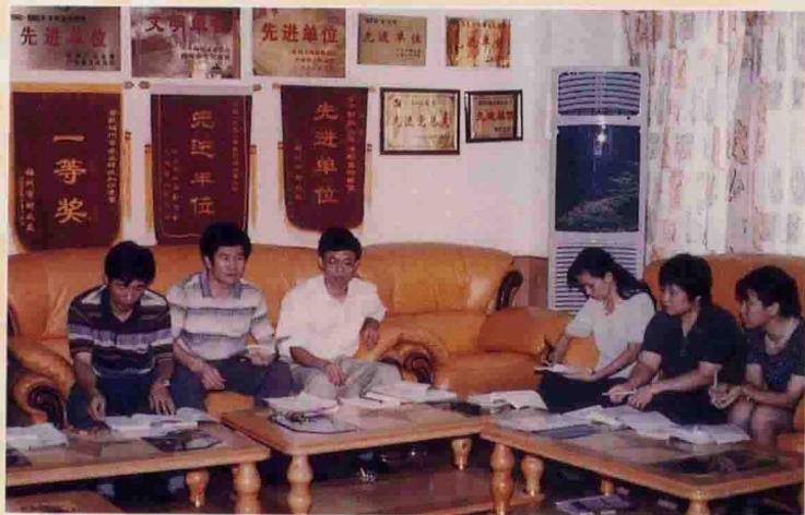
▲ 局领导深入股室征求意见和建议