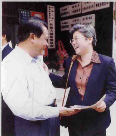
◀ 4月13日，国家侨联副主席唐闻生（右）来埔检查指导工作