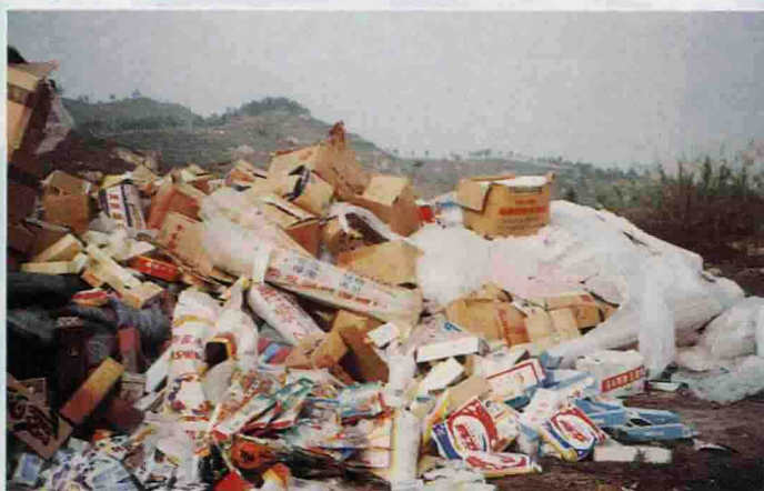
▲ 收缴的部分假冒伪劣商品

共检定衡器类器具 1 万多台（件）次，帮助企业查找产品标准 186 个，制定标准 54 个，帮助 110 家企业采用国家、行业标准生产产品 175 个。检查市场 237 个次、门店 2617 间次、生产厂家 25 家次；统检产品 30 多个，抽检 20 多个。查处假冒伪劣产品 150 多宗，立案 87 宗，没收销毁假冒伪劣产品货值 30 多万元。