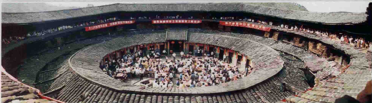
▲ 国际慈善单车之旅暨客家土楼茶会