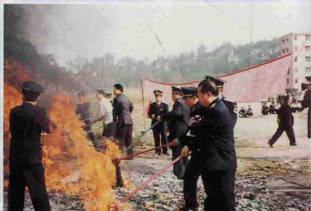
▲ 县政府领导和局领导亲自动手，燃烧销毁假冒伪劣商品