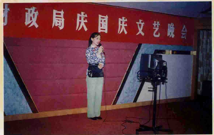
▲ 干部职工在局文艺晚会上引吭高歌