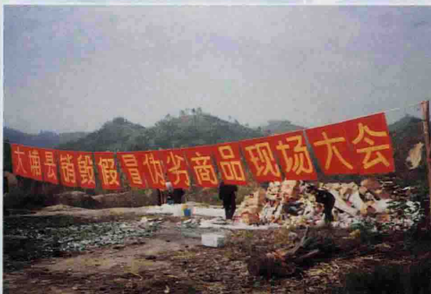
▲ 销毁假冒伪劣商品大会现场