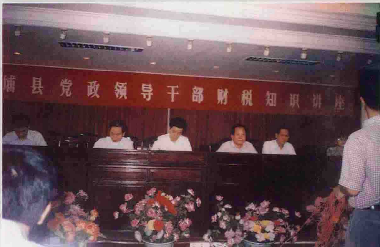
▲ 县举行党政领导干部财税知识讲座。图为大会会场