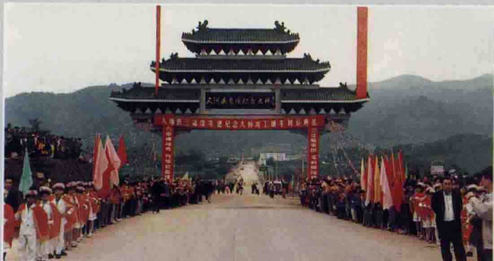
竣工通车庆典 三河坝朱德纪念大桥