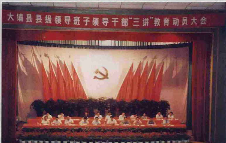
▶ 6月20日，县召开县级领导班子领导干部“三讲”教育动员大会。图为大会会场