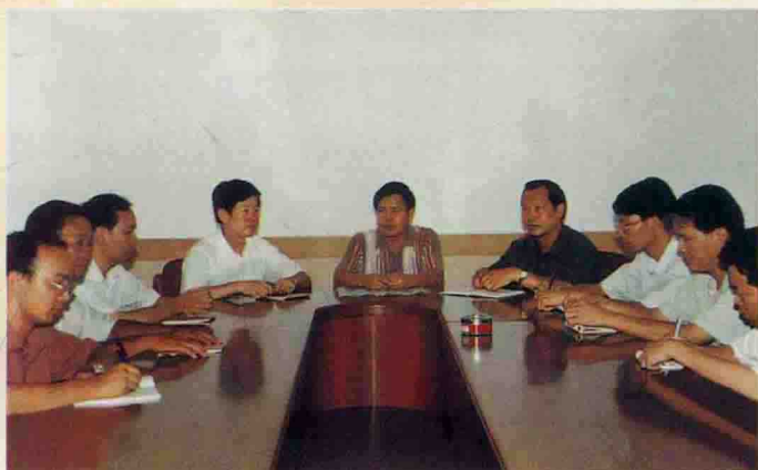
领导班子在研究国土工作