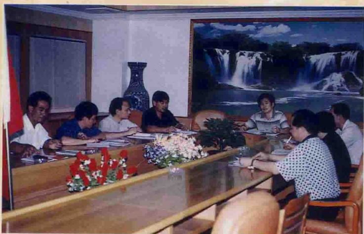
▲ 财政局领导班子在研究财政“十五”规划