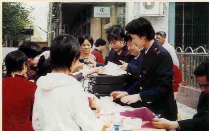
▲ 走向街头，宣传国家税收知识法规

2000年，大埔县地方税务局在上级局和县委、县政府的正确领导和支持下，紧紧围绕国家税务总局提出的“法治、公平、文明、效率”的新时期治税思想，以组织收入为中心，管查并举，挖潜增收，大力开展税法宣传，不断提高干部职工政治、文化素质，努力克服自1995年1月地税成立以来最严峻的收入困难，真抓实干，变压力为动力，全局上下团结一心，奋力拼搏。全局全年共组织地方各税、费收入6500万元，其中地方工商各税3913万元，完成省县共享收入和县级固定收入3662万元，对比上年同期增收182万元，增长5.23%，征收社保费2413万元，比上年增收236万元，增长10.8%，征缴率达96.5%，圆满完成上级局和县委、县政府下达的各项税收工作任务，为平衡大埔县级财政预算提供了有力保障。