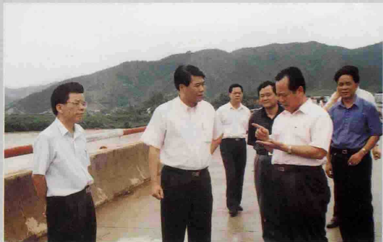
▲ 6月20日，广东省委常委、副省长欧广源（前左2）莅埔视察三河坝朱德纪念大桥