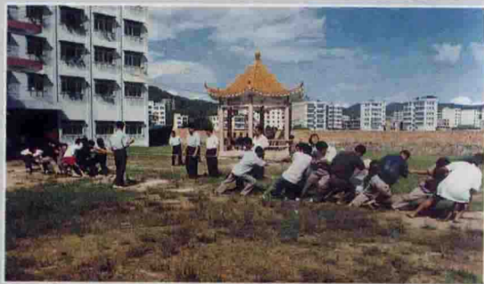
▲ 民政局党支部全体党员参加拔河比赛，庆祝建党80周年

2000年，大埔县民政局紧紧围绕让民政对象更加满意、让有关单位更加满意、让社会各界更加满意、让上级领导更加满意的“四满意”目标，抢抓机遇，开拓进取。积极推进社会福利社会化，初步建成了网络化的社会保障体系，完成了镇级界线的勘定，省、市、县、镇四级界线全部贯通，勘界工作如期完成，村民自治取得成效，农村基层政权建设得到加强；建成现代化殡葬设施——大埔县仙祖陵园，全年遗体火化率达73.4%，殡葬工作进入全市先进行列；“爱心献功臣行动”效果显著，县政府被全国双拥工作领导小组和国家民政部授予“爱心献功臣行动先进县”称号。县民政局被评为省“民政工作先进局”、梅州市“爱心献功臣行动先进单位”，被县委、县政府评为“两个文明建设先进单位”。