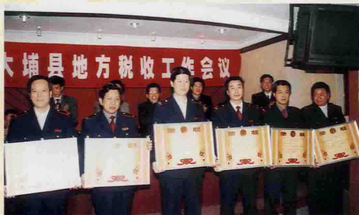
▲ 表彰在税收工作中做出优异成绩的先进单位