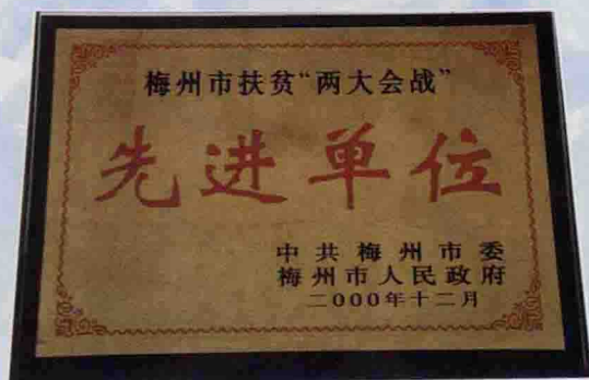
▲ 县交通局在扶贫“两大会战”中被市委、市政府评为先进单位所获奖牌

2000年，县交通局在上级领导下，知难而进，奋力拼搏，在运输市场管理、公路桥梁建设、公路养护、依法行政、运输安全和精神文明建设等方面取得了显著成绩，省交通厅厅长张远贻来埔视察时对此给予充分的肯定。