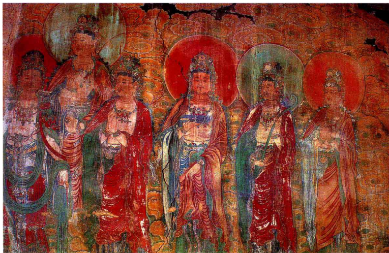
山西洪洞廣勝上寺毗盧殿壁畫十二圓覺(局部)