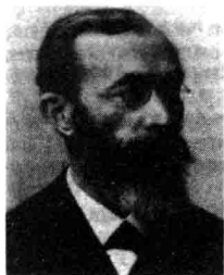
冯特 (1832 - 1920)

德国心理学家艾宾浩斯说：“心理学有一个悠久的过去，只有一个短暂的历史。”他这么说是有缘由的——早在古希腊时期，心理学就已萌芽，但直到一百多年前才被确立为一门独立的科学。