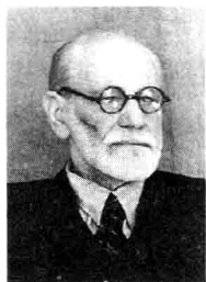
弗洛伊德（1856 - 1939）

精神分析 精神分析是弗洛伊德（Sigmund Freud）提出来的，相比行为主义者它更关注人的意识，特别是人的无意识现象。他们把无意识划分为前意识和潜意识，前者是指人们能从无意识中回忆起来的经验；后者虽然永远无法进入意识，但却是影响人们心理健康的重要成分，因而也成为精神分析的核心。对于这些观察不到的潜意识，弗洛伊德通过自由联想、梦的解析、对日常生活的分析等独特方式来探究。比如，你无意中说出“杀人”这两个字，那么弗洛伊德可能认为你潜意识中有伤害他人的倾向，因为你的口误出卖了你的潜意识。而关于梦的解析，若有兴趣可以阅读弗洛伊德的著作《梦的解析》，里面有更深入的阐述。当然，精神分析的独特之处就在于它特别关注个体的童年经验，在他们看来人体的心理问题与小时候的经历是分不开的。有暴力倾向的人可能是因为他们小时候受到虐待，因而在成年后以暴力的方式加以反抗。此外，弗洛伊德的心理动力论也是他解释暴力行为的一个重要理论。弗洛伊德认为人有两种本能：生的本能（性本能）和死的本能（侵犯本能），二者互为对立。在大多数情况下人的死的本能因为受到生的本能的阻碍不会指向内在的自我，而是投向他人，于是便形成攻击行为。例如，那些校园暴力者没有选择诸如跑步、搏击等体育运动这些非攻击行为来宣泄，而是通过攻击行为来释放死的本能冲动。