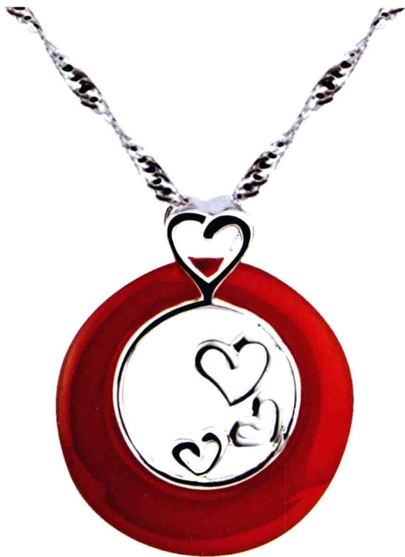
图 | 925 纯银红玛瑙吊坠——心心相印