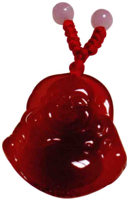
图 | 红玛瑙笑佛吊坠

阿爸率族人出发后，阿莫力就开心地跑到沙滩上去寻找最璀璨的玛瑙石去了。阿莫力正耐心地寻找着，突然一道金光在他明亮的大眼睛前闪了一下，他立即奔向金光。金光在水底，阿莫力一下子跳进了水中。过了一会儿，阿莫力找到了一颗如金子般璀璨的圆圆的玛瑙石。