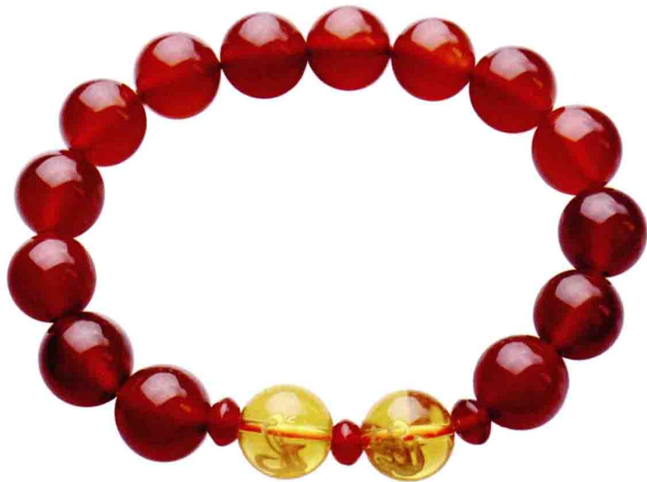
图 | 天然红玛瑙手串