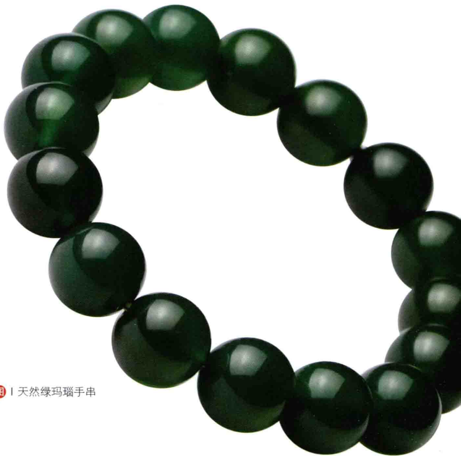
图 | 天然绿玛瑙手串