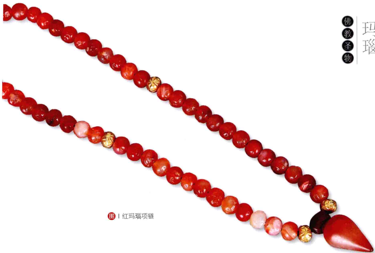
图 | 红玛瑙项链

玛瑙属于三方晶系。常呈致密块状而形成如乳房、葡萄、结核等各种构造，同心圆构造是最常见的。玛瑙呈半透明至透明状，断口呈贝壳状，具有玻璃光泽。所谓光泽，即宝石矿物表面对光的反射能力。根据光泽的强弱可以将光泽分为金属光泽、半金属光泽、金刚光泽和玻璃光泽等。莫氏硬度 6.5 ~ 7，比重 2.6 ~ 2.7，折光率 1.535 ~ 1.539。