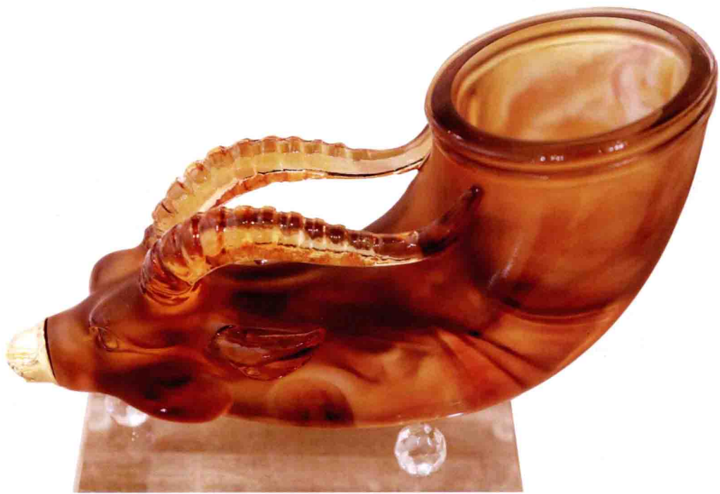
图 | 镶金兽首玛瑙杯

在西方的神话中有这样一个故事。阿佛罗狄是一位爱和美的女神，有一天她躺在树荫下休息，这时她的儿子爱神厄洛斯趁她睡熟，把她闪闪发光的指甲偷偷剪了下来。厄洛斯对指甲爱不释手，还高兴地飞了起来。飞到空中以后，厄洛斯一不小心把指甲掉落了，而掉落到地上的指甲变成了石头，形成了玛瑙。许多人认为拥有玛瑙，可以促进自己与爱人之间感情的升华。