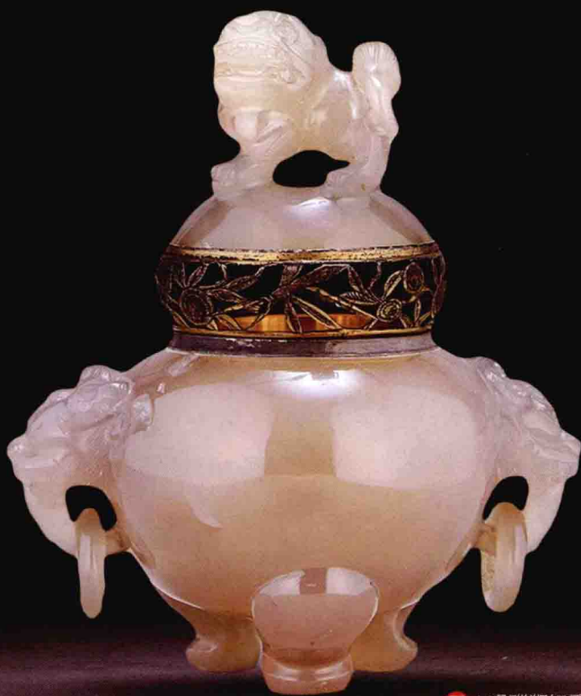
图 | 玛瑙狮钮香炉

玛瑙拥有悠久的历史，伴随人类走过了千年岁月，在古今中外漫长的文化积淀中，形成了许多关于玛瑙的神话传说。