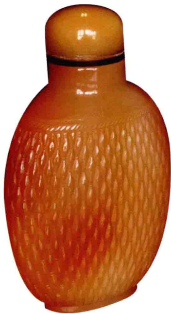
图 | 玛瑙鱼菱纹鼻烟壶

阿莫力捧着金色的玛瑙欢呼雀跃，很快夕阳西沉了，他累了，就躺在草地上，进入了甜甜的梦乡。他把放着迷人的金光的玛瑙放在了胸脯上。