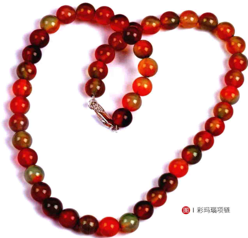
图 | 彩玛瑙项链

玛瑙是水晶的基床，玛瑙矿石上经常长有水晶，玛瑙同水晶一样化学成分都是二氧化硅。玛瑙硬度很大，以前科技与生产技术水平都不发达，因此玛瑙制品比较奢侈，寻常百姓是买不起的，但玛瑙外观惹人怜爱，从古至今，经久不衰。