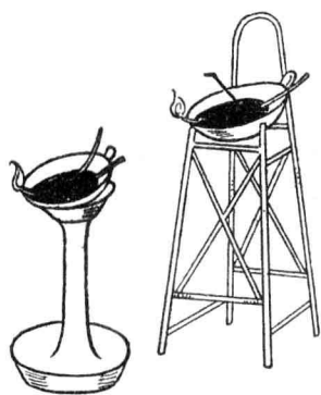
（圖四）我國的舊式油盞

我國舊式的油燈，俗名油盞（圖四）形狀是一個盤，或是一只缸，用陶器或金屬做成的都有。所用的燈油，都是從植物的種子裏面榨出來的。最普通的