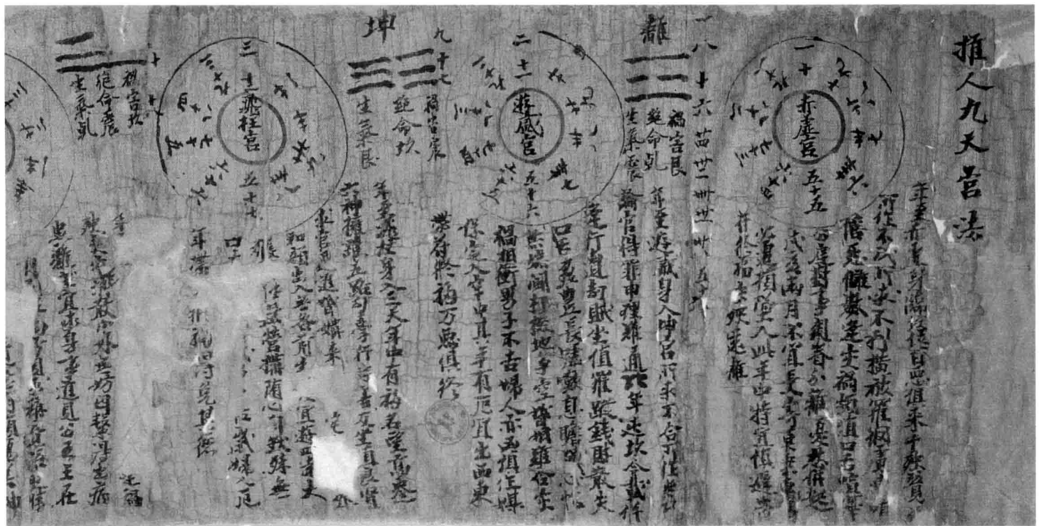
三 法 Pel.chin.2842V 0 推人九天宮法