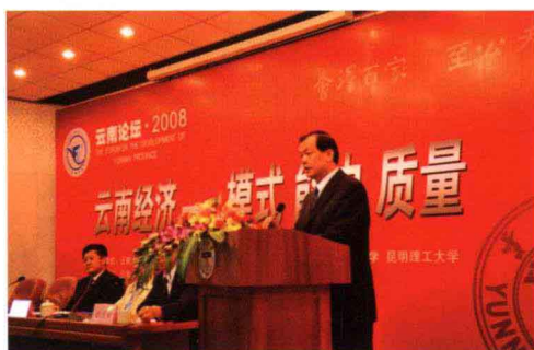
省政协副主席罗黎辉同志发表重要讲话