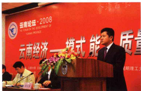
省委常委、省统战部长黄毅同志发表重要讲话