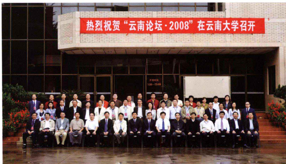
“云南论坛·2008”嘉宾合影