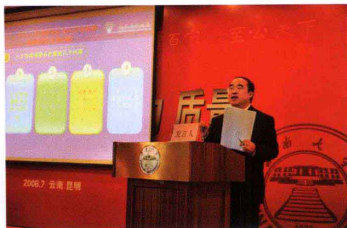
云南师范大学武友德教授发表演讲