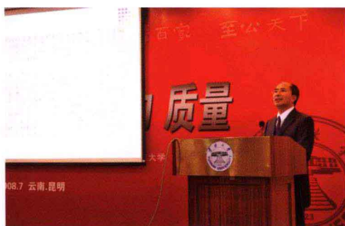
云南大学张荐华教授发表演讲