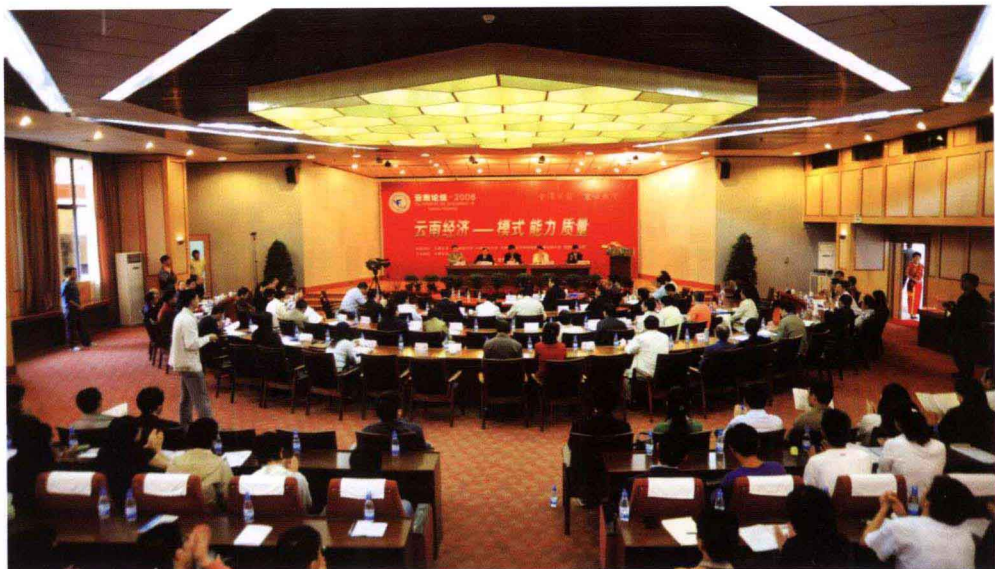
“云南论坛·2008”盛大开幕