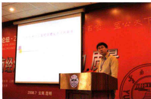
云南大学吕昭河教授发表演讲