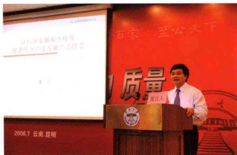
云天化集团董事长发表演讲