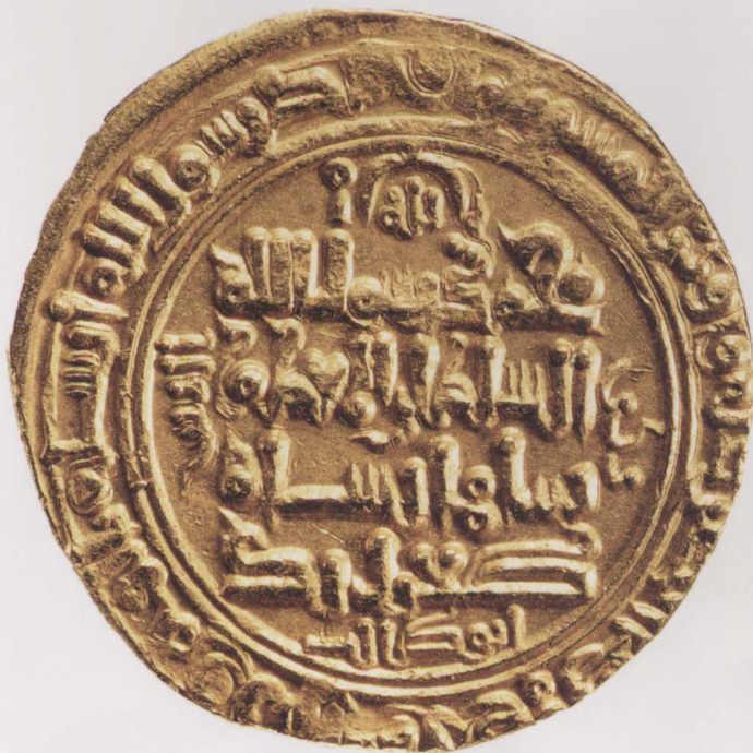
第8页：大塞尔柱王朝苏丹图格里勒·贝格(Toghril Beg)的“第纳尔”(dinar)，约1056年~1057年在阿瓦士(Ahvaz)铸造。(伦敦大英博物馆藏)

不可思议的是，这一社群的组成也涵盖了所有的教派，即便其中一些教派对伊斯兰教来说是背离正道的。另外生活在“伊斯兰之域”(dar al-Islam，指在原则上为伊斯兰律法所统治的区域)里的非穆斯林也算在内。因此为了遵循律法中人的理念，伊斯兰教致力于做到宽容和生活化，为现实所有方面找到一席之地。