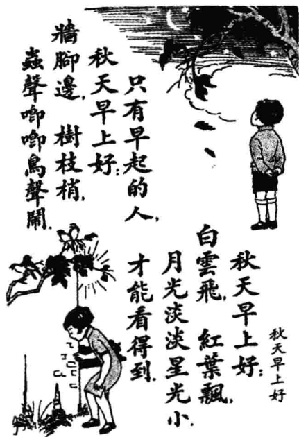
图文并茂的课本内容

子恺为首的众多画坛名宿也亲自挥毫泼墨，为新式教材描绘插图，增添生趣，以尽绵薄之力。由此，民国教育也被推向了一个蓬勃发展、空前繁荣而又颇为短暂的黄金时期。