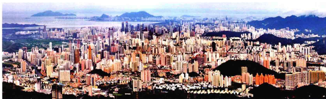
图 1.3 深圳全景图 / 深圳

北京作为中国的首都，政治中心，同时承载着多项城市功能。进入 20 世纪以来，北京的城市化发展进程进入加速阶段，人口、建设规模不断扩张，屡次冲破规划指标，城市问题凸现。北京要发展成为世界城市，对于城市发展现状的深刻认识以及对城市未来建设的合理规划是完成目标的重要保证。