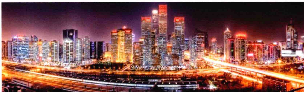
图 1.2 国贸夜景 / 北京

上海是中国最大的经济中心城市，也是国际著名的港口城市。在中国的经济发展中具有极其重要的地位，地处南北海岸线中心，长江三角洲东缘，长江由此入海，交通便利，腹地宽阔，地理位置优越。现代化的上海像磁石一样吸引了世界各地的人群，是一座既怀旧又现代、既东方又西方的国际化都市。