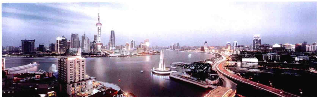
图 1.1 外滩全景 / 上海

上海是中国最大的经济中心城市，也是国际著名的港口城市。在中国的经济发展中具有极其重要的地位，地处南北海岸线中心，长江三角洲东缘，长江由此入海，交通便利，腹地宽阔，地理位置优越。现代化的上海像磁石一样吸引了世界各地的人群，是一座既怀旧又现代、既东方又西方的国际化都市。